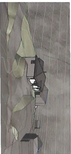
3D View 2