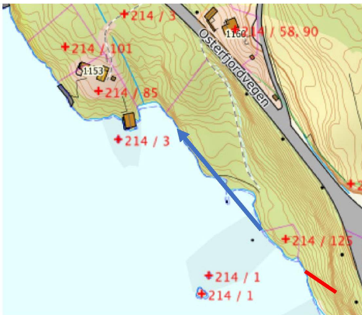
Figur 1 viser fortsatt tilgjengelig ikke utbygget strandlinje ca 120 meter nord/vest. Rød strek viser hvor terrenget like etter 214/125 ikke blir tilgjengelig verken i strandsonen eller mot terrenget over.

I denne sammenheng er det KPA 2011-23 for Lindås (nå del av Alver) det dispenseres fra. Her er eiendommen LNF og i strandsonen. De vesentlige årsaker bak KPA i denne sammenheng er rikspolitiske lover og bestemmelser som skal beskytte nevnte Strandsone og friluftsliv. Det pekes i denne sammenheng på Fylkesmannen i Hordaland sin grundige gjennomgang ved fradeling av tomten i 1987, med begrunnelse at fradeling av naustetomten ikke var til vesentlig ulempe for allmenne friluftsinnteresser og at det heller ikke forelå andre offentlige eller private interesser som taler mot godkjenning. Sentral lovgivning og føringer for Strandsone og friluftsliv er i all hovedsak det samme som den gangen. Cardo 8614 AS tiltrer de vurderinger som Fylkesmannen i Hordaland gjorde den gangen. Vi peker på at dette er den «blinde enden» av et lengre tilgjengelig og ubebygget strekk av strandlinjen (ca 120 m) nord/vestover. Det pekes videre på at dersom en går den sti som går i strandsonen så går den innenfor den allerede utsprengte nausttomten, som er på et eget nivå med en barriere mot stien ferden i strandsonen for øvrig,