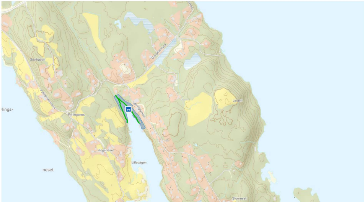
Figur 2, Bergen og omlands friluftsområde, Fyllingsnes – Litlevågen.

Nyere rikspolitiske føringer enn Fylkesmannens avgjørelse om fradeling av naustetomten som kan være relevante er barn og unges interesser i planleggingen og samordnet areal og transportpolitikk.