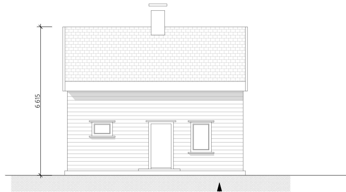
Fasade sett fra Øst etter ombygging skala 1:100