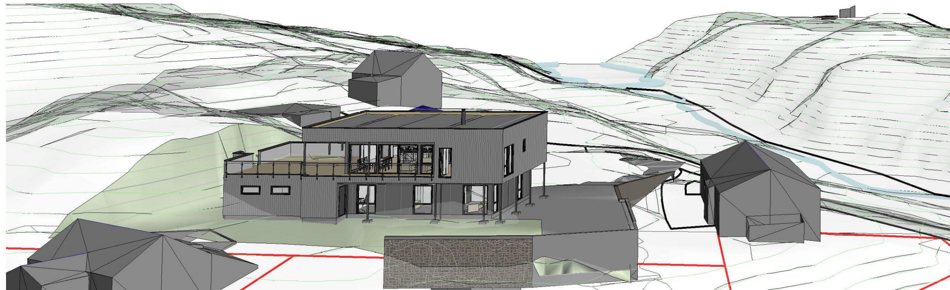
3D View 1