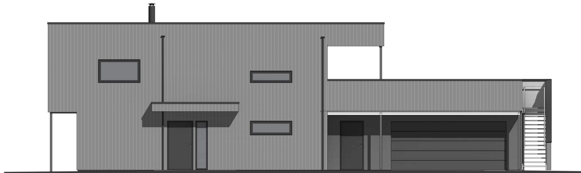
nord 1 : 100