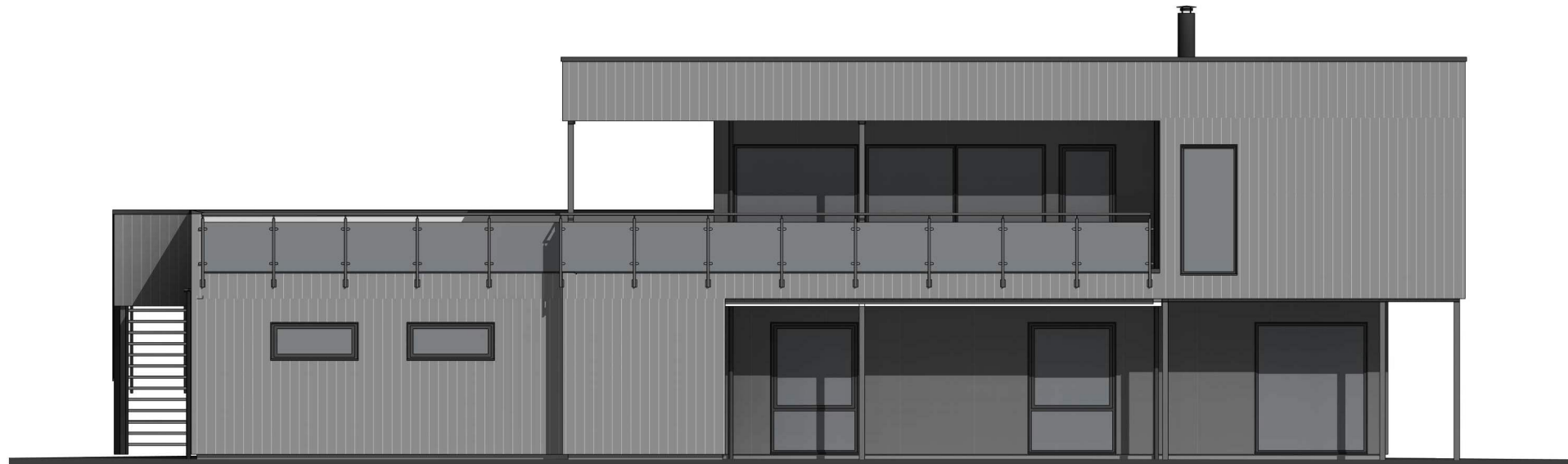
sør 1 : 100