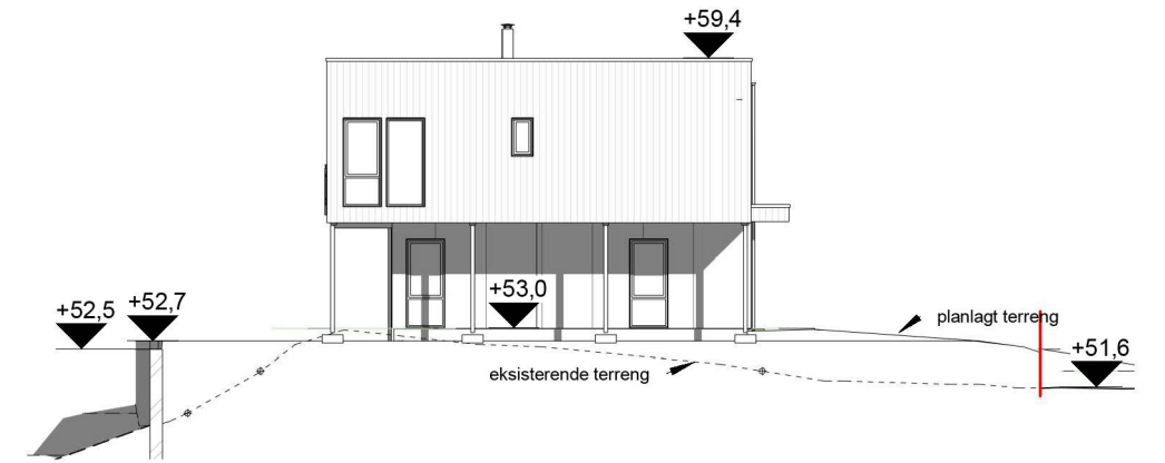
øst 1 : 200