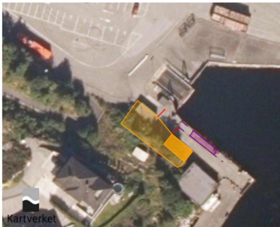
Figur 2 Flyfoto med plasseringer

Det vert elles vist til vedlagte utgreiing om tiltaket.