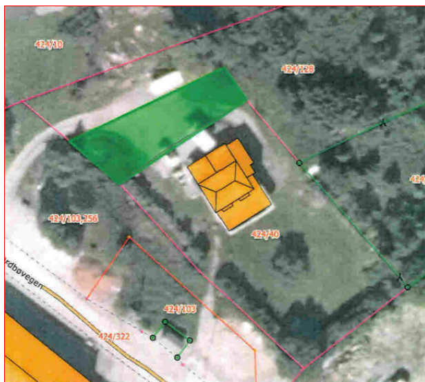
Utsnitt av situasjonsplan datert 01.12.2021

Plassering av tiltaket er synt i situasjonsplan datert 01.12.2021.