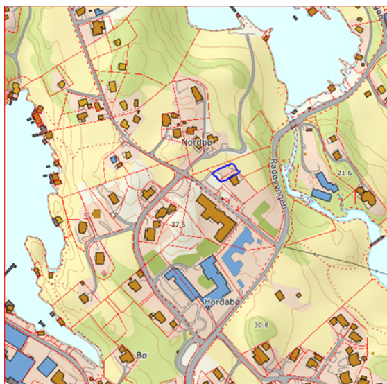
Oversiktskart. Areal markert med blå ring.