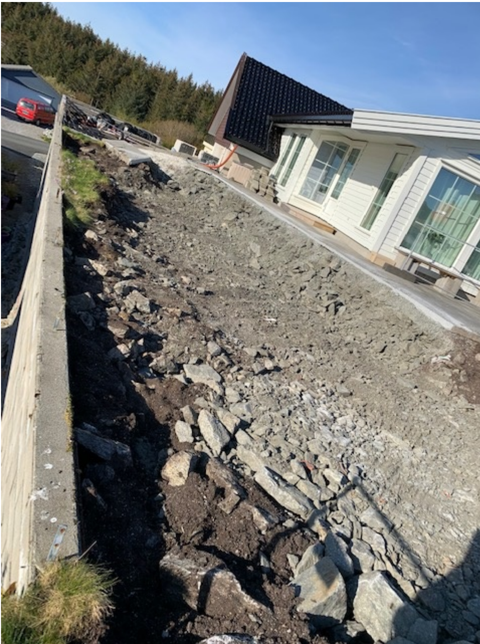
Viser masser som er lagt ut på friområdet