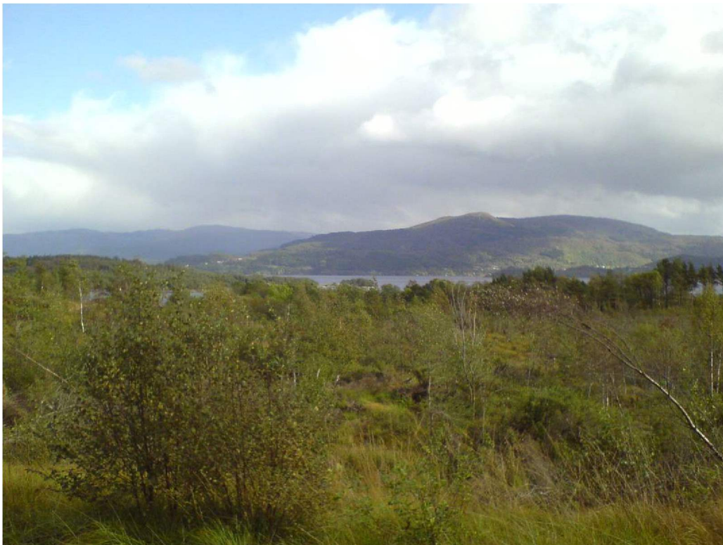
Frå E-39 mot sør-aust.

Planområde stig frå sør mot nord og har gode solforhold og utsikt. Vegetasjonen i området består for det meste av buskvekstar, litt bjørk, furu og osp. Det er truleg ikkje så djupt ned til fjell av di det stikk opp berg i dagen fleire plassar.