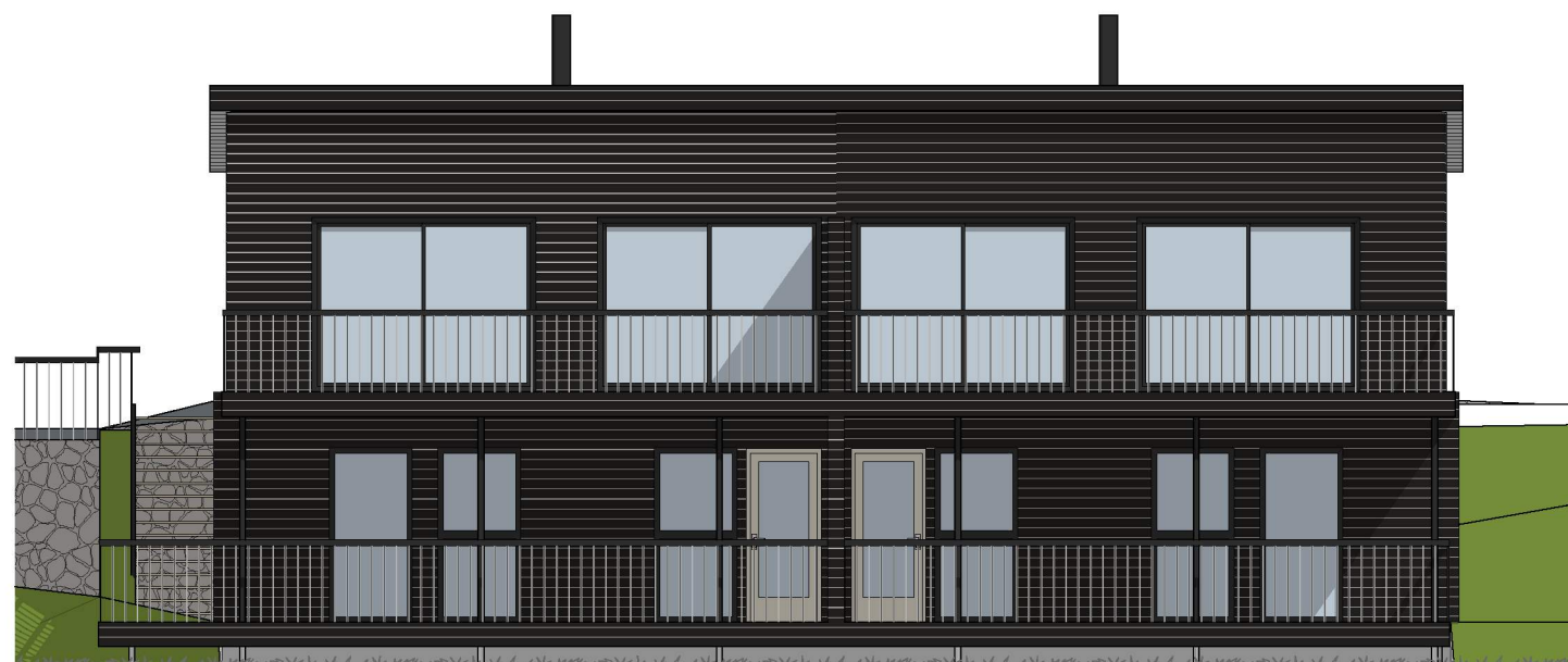
1:100 Fasade Øst