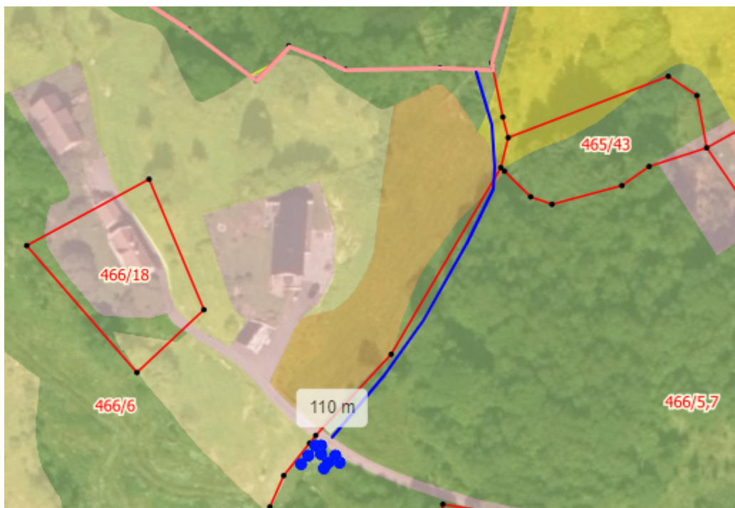
Figur 2 flyfoto og markslagskart- veg og snuplass skissa med blå strek

I Nibio gardskart er gbnr 466/6 registrert med 1,9 daa fulldyrka, 4,7 daa overflatedyrka, 12,9 daa innmarksbeite, 12,7 daa produktiv skog, 1,9 daa anna markslag, 1,9 daa bebygd/samferdsel. Sum 36 daa.