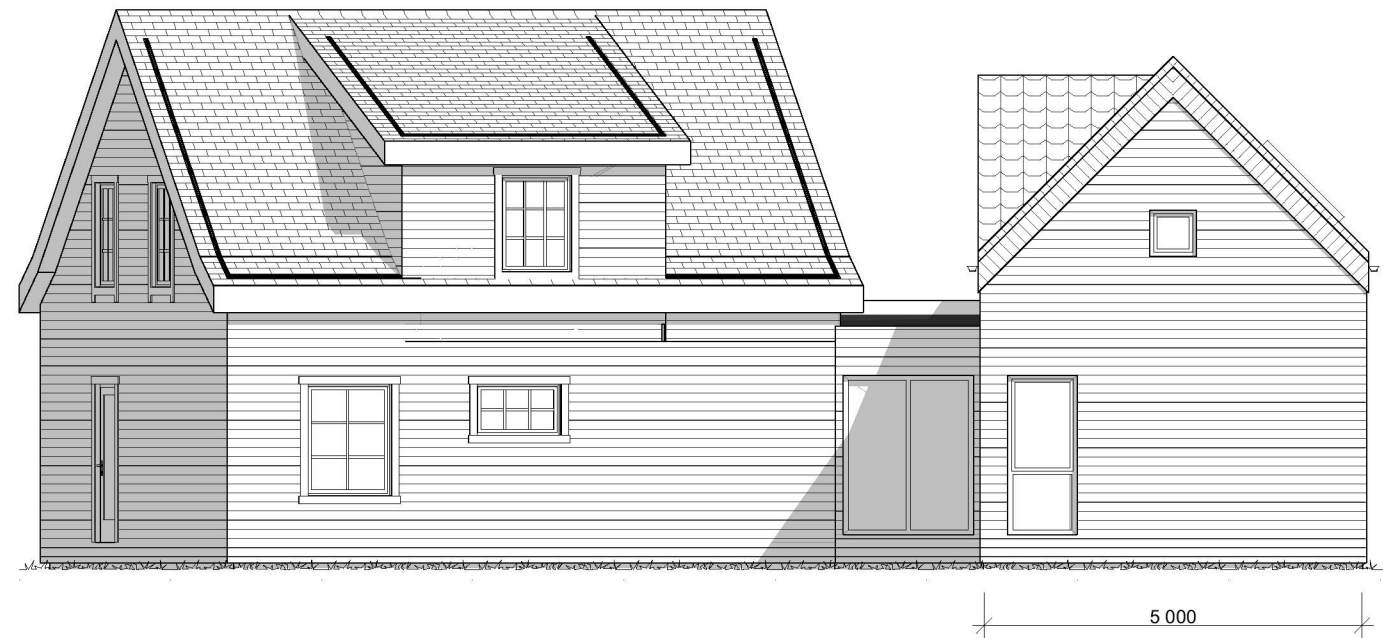
1:100 Fasade Nord