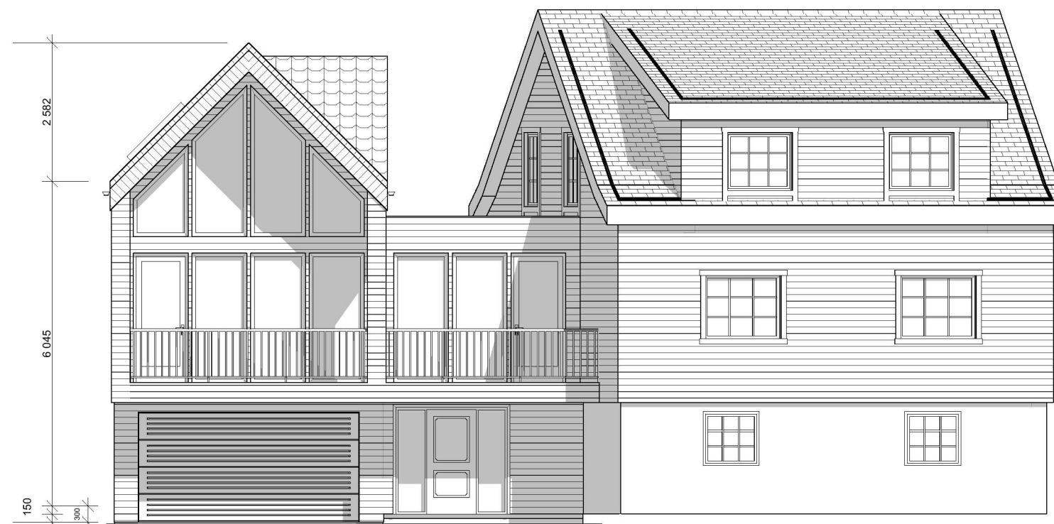
1:100 Fasade Sør