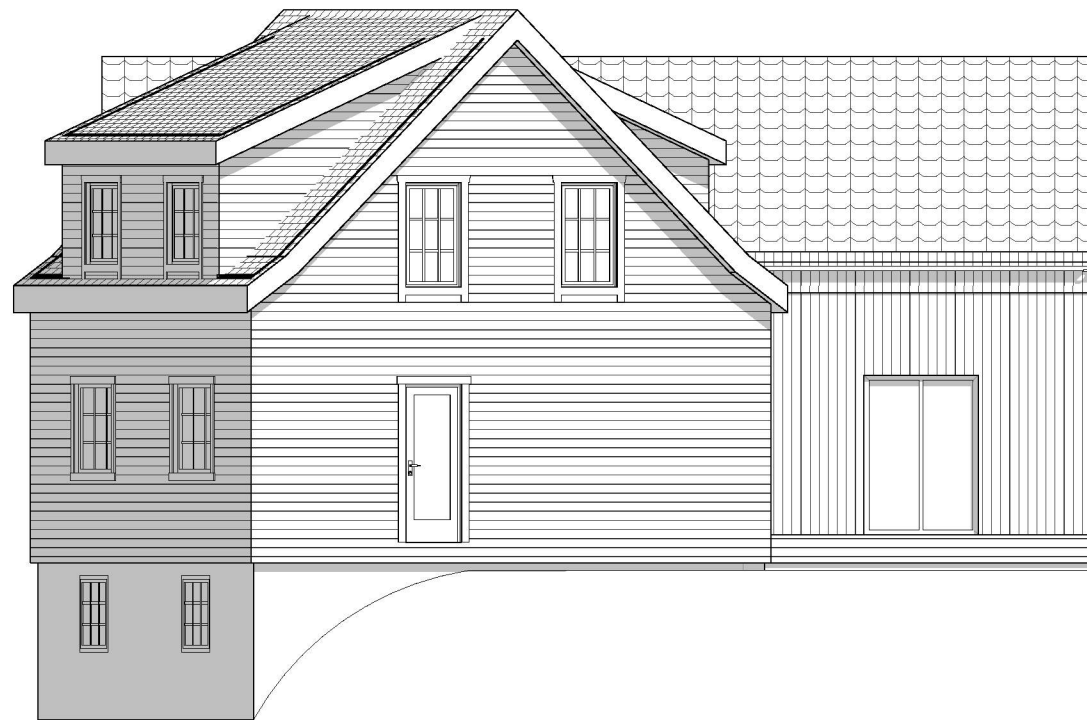
1:100 Fasade Øst