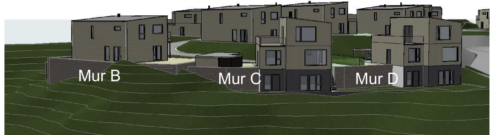
Tomt B1b-04 Mur B