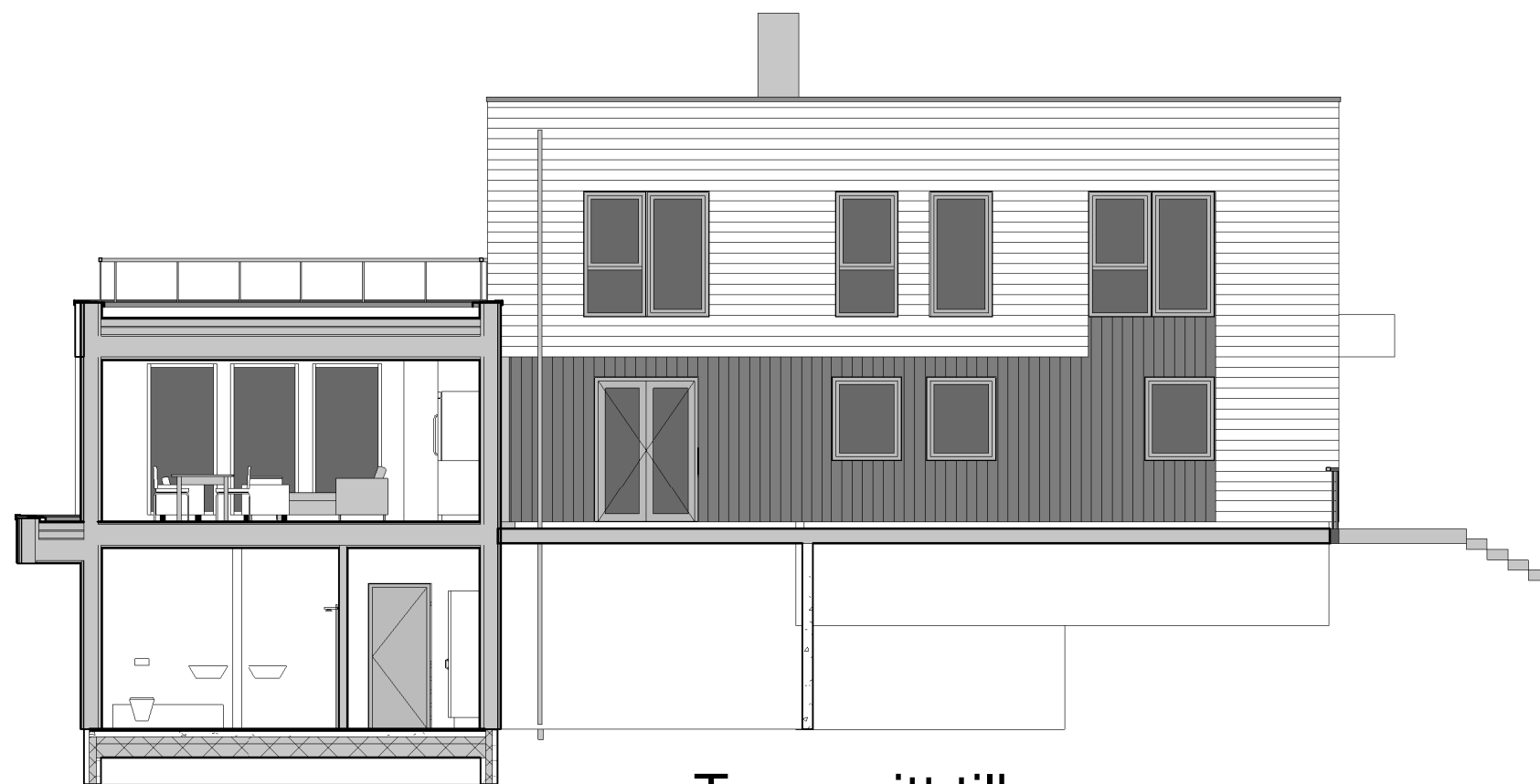
2 Tverrsnitt tilbygg 1 : 100