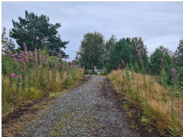
Sti frem til tomten

Tomten har veirett frem til hovedbruket gbnr 106/7. Parkering skjer for enden av Fonnebustvegen på gbnr 106/7, og derfra er det sti frem til tomten.