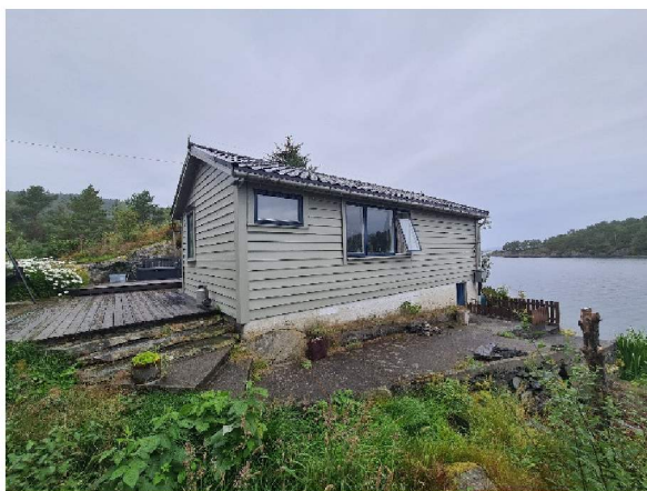
Fasade mot sørøst (mot naust)