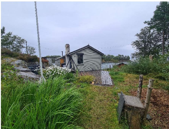
Sørvegg på hytten