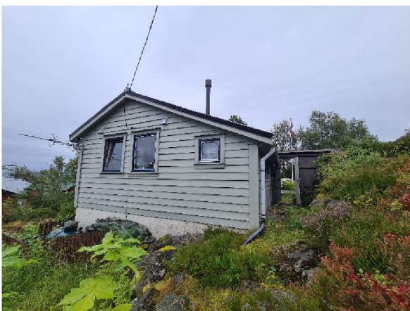
Fasade mot nordvest (mot sjø)

Hytten har ikke innlagt vann, men takvann oppsamles og drikkevann medbringes.