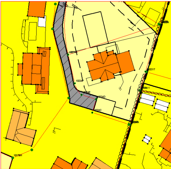
Utsnitt fra reguleringsplanen