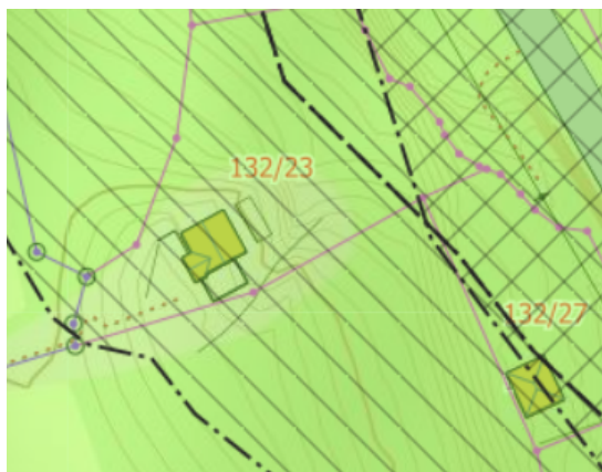
Plankart - utsnitt av kommunedelplan

Ansvarleg søkjar opplyser at det vert no sendt inn ny søknad då tiltakets rammeløyve gjekk ut før inngangsetjingsløyve vart gjeve. Det må av den grunn søkjast på nytt for tiltaka i saka.