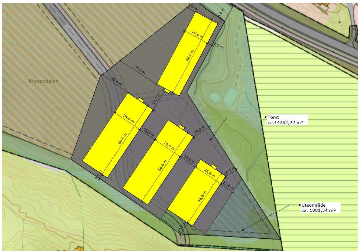
Figur 4: Mogleg situasjonsplan.