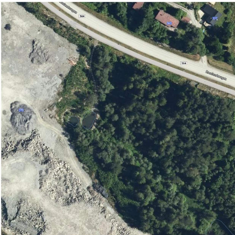
Figur 2: Fangdam ein og to.

I 2012 fekk planen planføresegn og omsynssoner i plankart som skulle sørge for at vassdraget i aust ikkje fekk skadeleg avrenning frå utbygginga. Mjåtveitvassdraget har førekomst av den trua arten elvemusling, som allereie då var i sterk tilbakegang. Mykje skyldast nok ein reduksjon i vasskvaliteten. Ein reinsepark med to fangdammar skulle etablerast med næringsparken, mens ein tredje kunne bli aktuell. Alle tre dammane er der i dag. Det er ikkje kjend naturlege bestandar med elvemusling her.