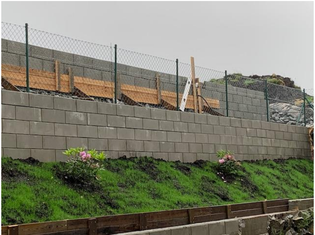
Bilde 3 viser mur nr. 3