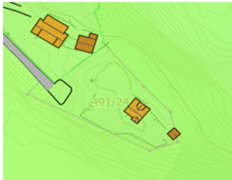
Plankart – utsnitt av kommuneplan