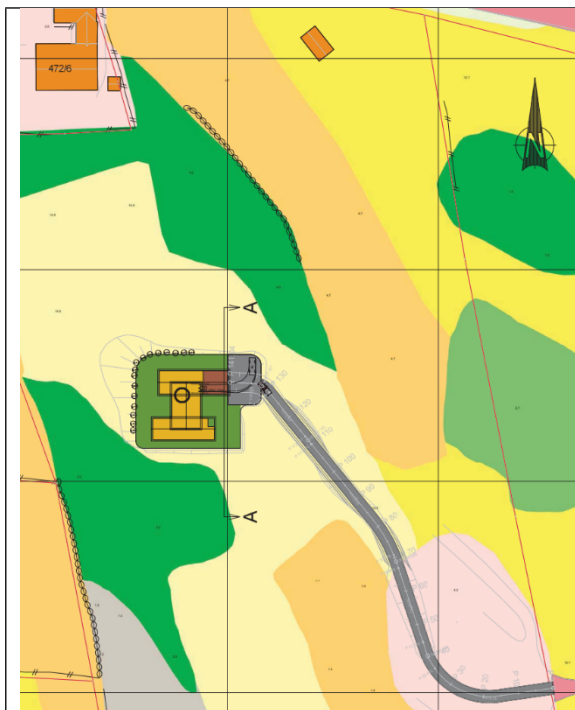
Situasjonskart på marklagskart

Eigedommen er lokalisert på Radøy, og er ein aktiv landbrukseigedom. Berekna teigareal totalt på 177102,5 m2, og noverande hovudnæring er eggproduksjon med 7500 høner.