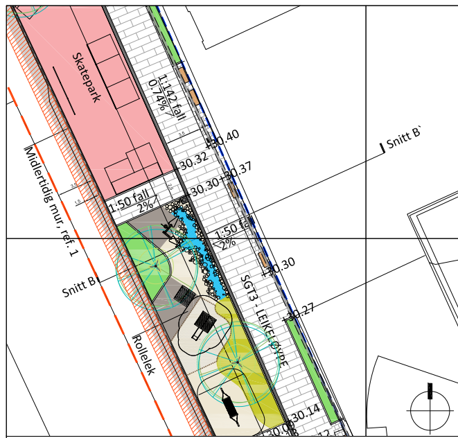
Plan - Snitt BB` 1:500