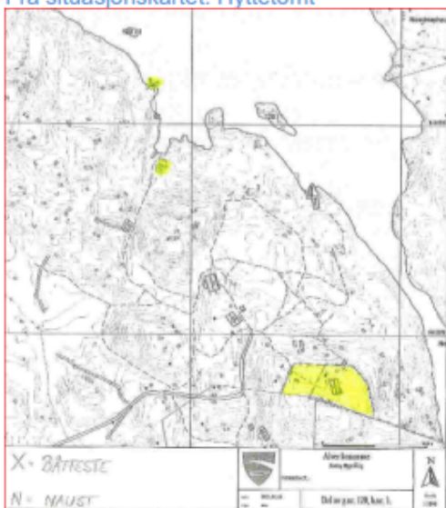
Frå situasjonskartet. Oversiktskart