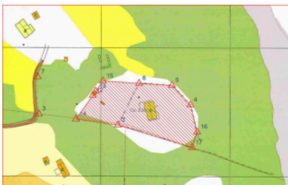
Frå situasjonskartet. Hyttetomt

Søklar skriv: På dette området ligger brønnen som vi deler med gårdshuset, og da får vi halvparten av brønnen. Det ligger også et vedskjul som tilhører hytten på dette området. I tillegg har vi en bil som vi bruker fra fergen på Tyborgnes siden, og på dette området er det også parkeringsmuligheter. Det er nødvendig med parkeringsplass dersom det skulle komme skogsvei i fremtiden. Veien til hytten går også i dette området.