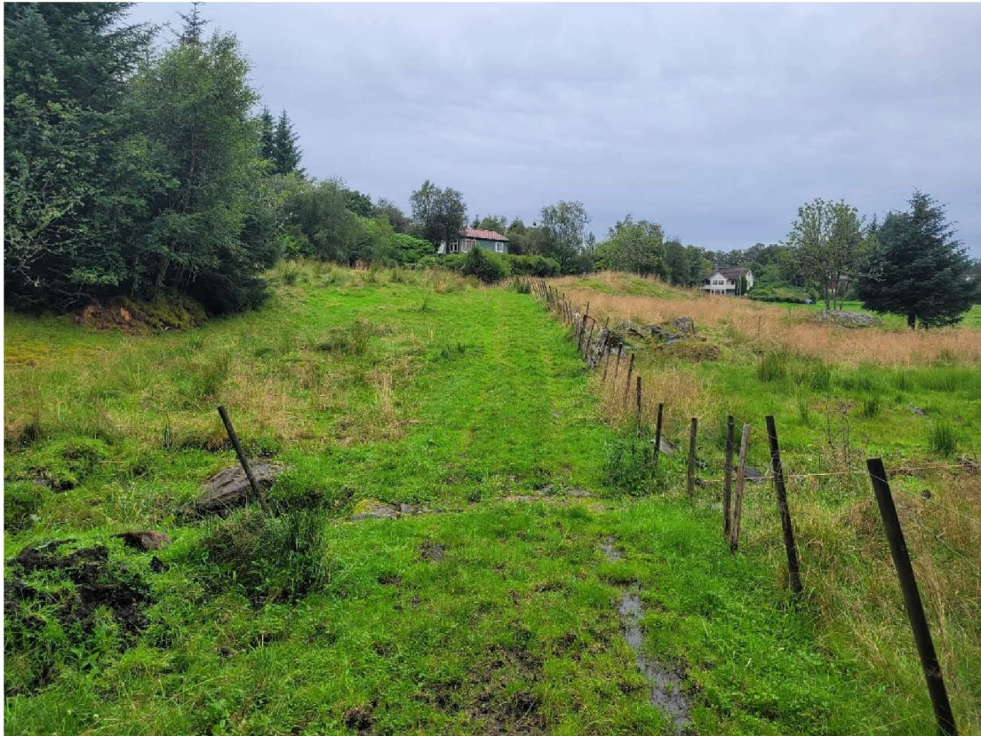
Figur 3 Kjerrevei 351/ 9