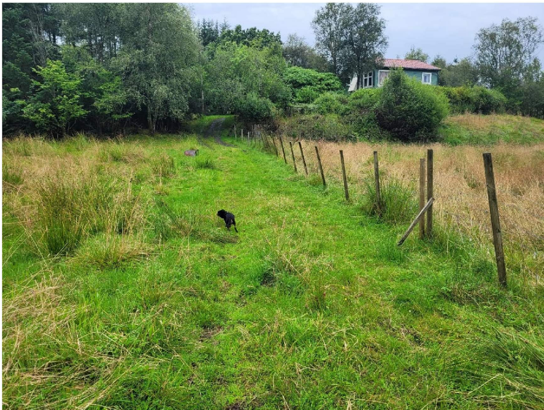
Figur 4 Kjerrevei 351/ 9