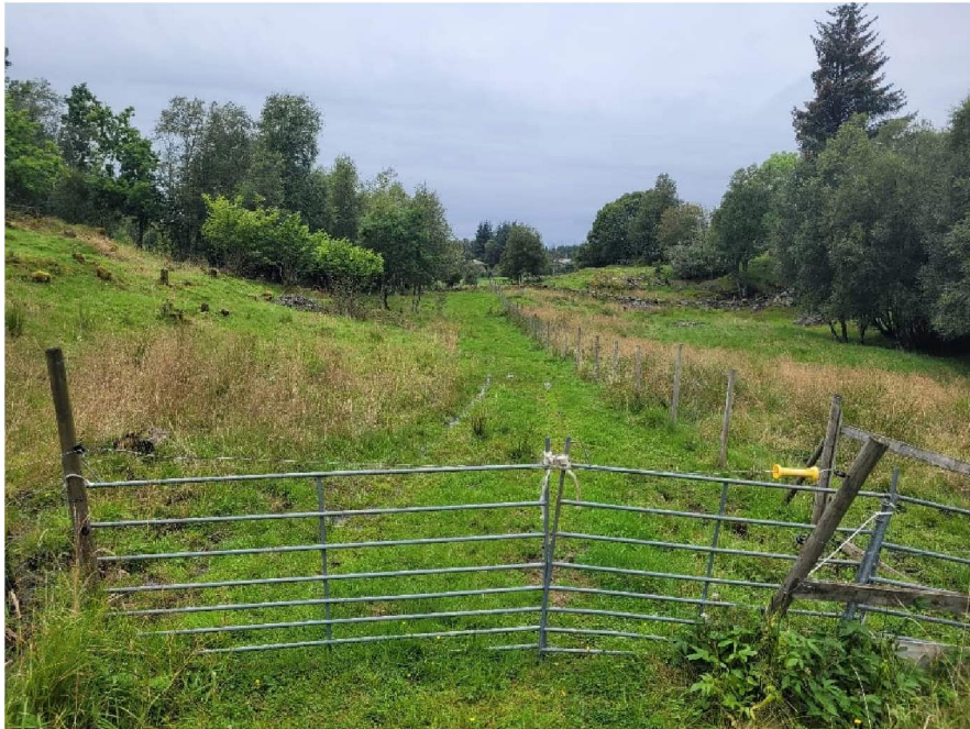
Figur 1 kjerrevei 351/ 1