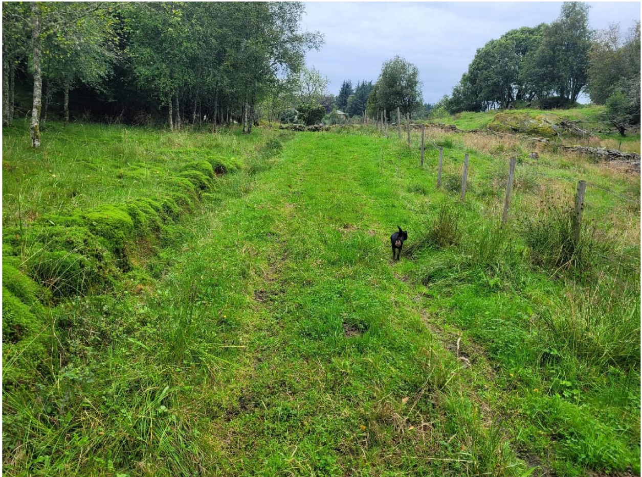
Figur 2 Kjerrevei 351/ 1