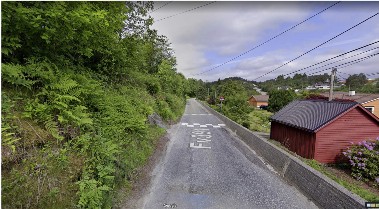
Leknesvegen sett fra sør. Hytten på gbnr 195/77 ligger til venstre for veien, oppe i terrenget.

Det antas at fordelene ved å gi dispensasjon fra plankravet, oppveier eventuelle ulemper.