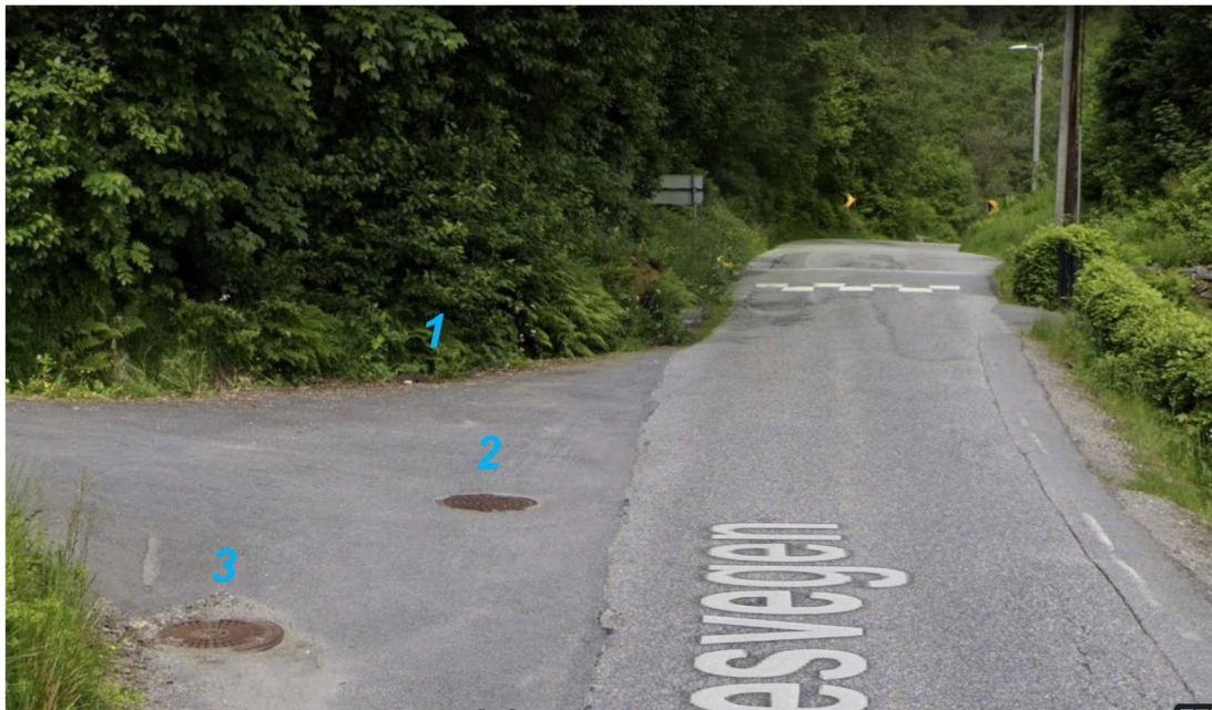
Avkjørsel til gbnr 195/77 sett fra sør.

Det er plassert tre kummer i avkjørselen (de er markert med blå tall i bildet under). Vi antar at kum nr. 1 og 3 håndterer overflatevann. Kum to er antakelig stakebrønn for offentlig avløpsledning.