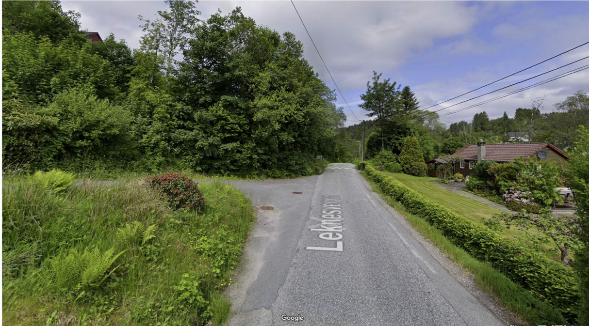
Avkjørsel til gbnr 195/77 sett fra sør.

Vedlagt er terrengsnitt A1-401 som viser lengdeprofil i avkjørsel og videre opp til hytten på gbnr 195/77. Det digitale kart (kjøpt gjennom Ambita) viser at Leknesvegen har markant tverrfall, men når man sammenlikner med foto fra stedet (se over), så ser man at Leknesvegen er relativt horisontal, og har et lokalt høydepunkt ut for avkjørselen til gbnr 195/77. Vann vil altså ikke samle seg i kjørebanelen ut for avkjørselen , men gå i ristene før de kommer ut i Leknesvegen, mens regnvann i selve vegbanen vil renne ned i havene mot øst, som ligger lavere enn Leknesvegen.