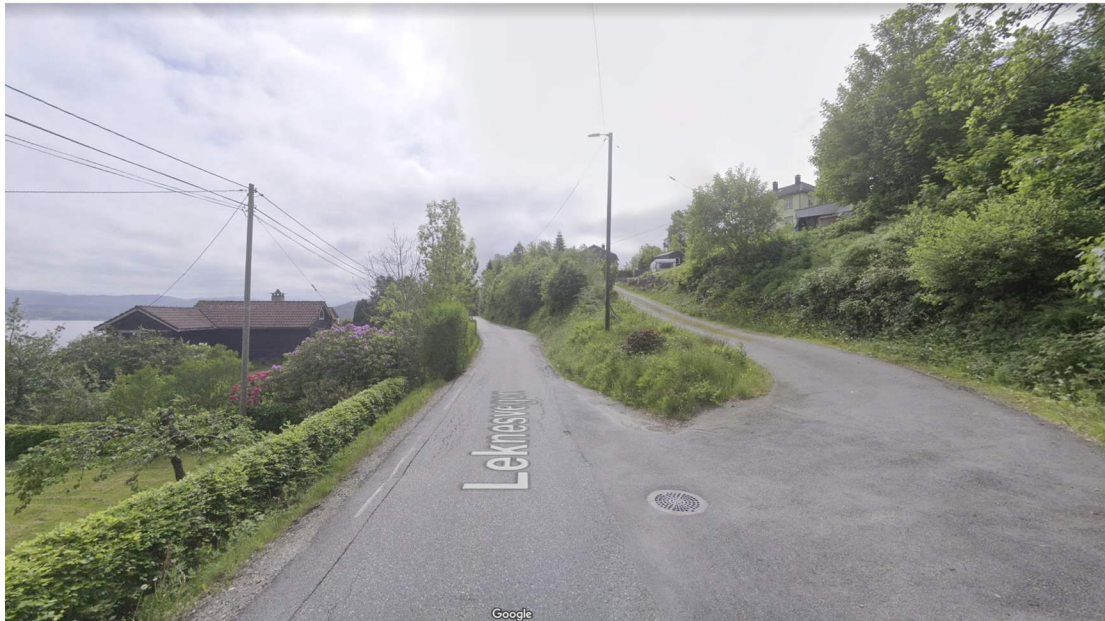
Avkjørsel til gbnr 195/77 sett fra nord.

Avkjørselen er fra før opparbeidet med asfalt fra fylkesveien og delvis opp til eksisterende hytte.