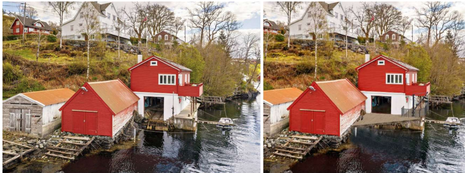
Illustrasjon av vestfasaden av eksisterende og ny situasjon.

I denne saken er det snakk om å oppføre en brygge foran eksisterende naust, over dagens slipp, for å utbedre mulighetene for lagring av båter. I dag fortøyes eierens båt langs sørfasaden som vist på bilde under. Fortøyning av båt er komplisert i det smale sundet pga passerende fritidsbåter og Norleds sine passasjerbåter. Blir tiltaket godkjent vil en kunne fjerne dagens fortøyningsanretning.