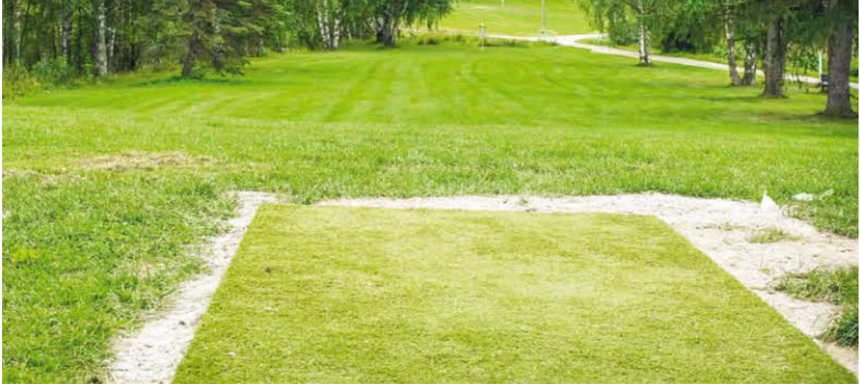
AM TeePad 2,5 x 1,5m