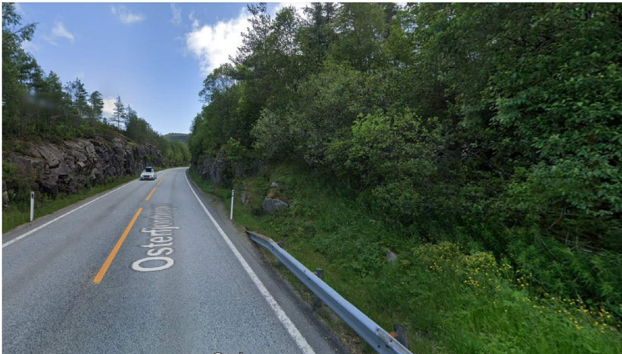
Bilde som viser situasjon der hvor gang-/sykkelveg vil slutte dersom den videreføres i henhold til reguleringsplankart.

Statens vegvesen har påpekt at tilbudet til myke trafikanter er avsluttet ved bussholdeplassen, og ikke videreført resterende 340 meter i retning Ostereidet. Vi er enige i at i henhold til planen så er ikke rekkefølgekrav §1.4.7 « Delområda KBA1 og KBA2 kan byggast ut før gang- og sykkelvegen vert opparbeidd og teken i bruk », utført, og det er dermed fortsatt et juridisk bindende rekkefølgekrav. Her kan det nevnes at det i hele planprosessen og i planmøter har fremkommet at rekkefølgekravene har vært knyttet fra og med de nye busstoppene og til Mykingvegen. Den resterende delen av gang- og sykkelvegen kom inn på slutten i planprosessen for at en skulle få en helhet i reguleringsplanen og det var ikke tenkt som en del av rekkefølgekravene for å bygge ut næringsområdet. Dette viser også utbyggingsavtalen som er inngått med SVV. Utbyggingsavtale som er i henhold til det som per nå er utbygget og ferdigstilt av gang- og sykkelveg langs E39, samt byggeplanefte er vedlagt. Avtalens overskrift lyder som følger: « Avtale Mellom ATR, Nordhordland Næringspark AS og Statens Vegvesen Region vest (SV) om etablering av nytt kanalisert kryss på E39 med busslømmesystem v/ Eikanger i Lindås kommune og gang- og sykkelveg fram til kryss med Fv 397 ». Videre, under pkt 2 står det: « Godkjent byggeplan av Statens vegvesen datert 5. mai 2016 vert gjeldande for omfanget av utbygginga », se også vedlagt byggeplan.