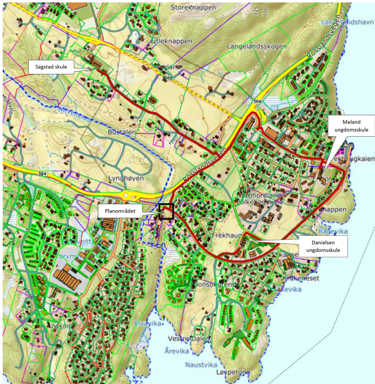
Figur 2: Oversikt over trygge gangveier i området (NHdigi.no)

Planføresegnene blir utvida med denne føresegna under § 16 rekkjefølgjekrav som er i samsvar med teksten i brevet frå fylkeskommunen. Det skal vere etablert trygt tilbod for mjuke trafikantar til næraste skule før bruksløyve for bueiningane i BFS. Under er det vist kvar det er etablert gode breie fortau med moglegheit for trygg ferdsel.