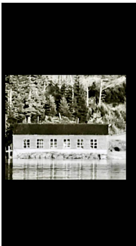
Bjørndal sagbruk 1938