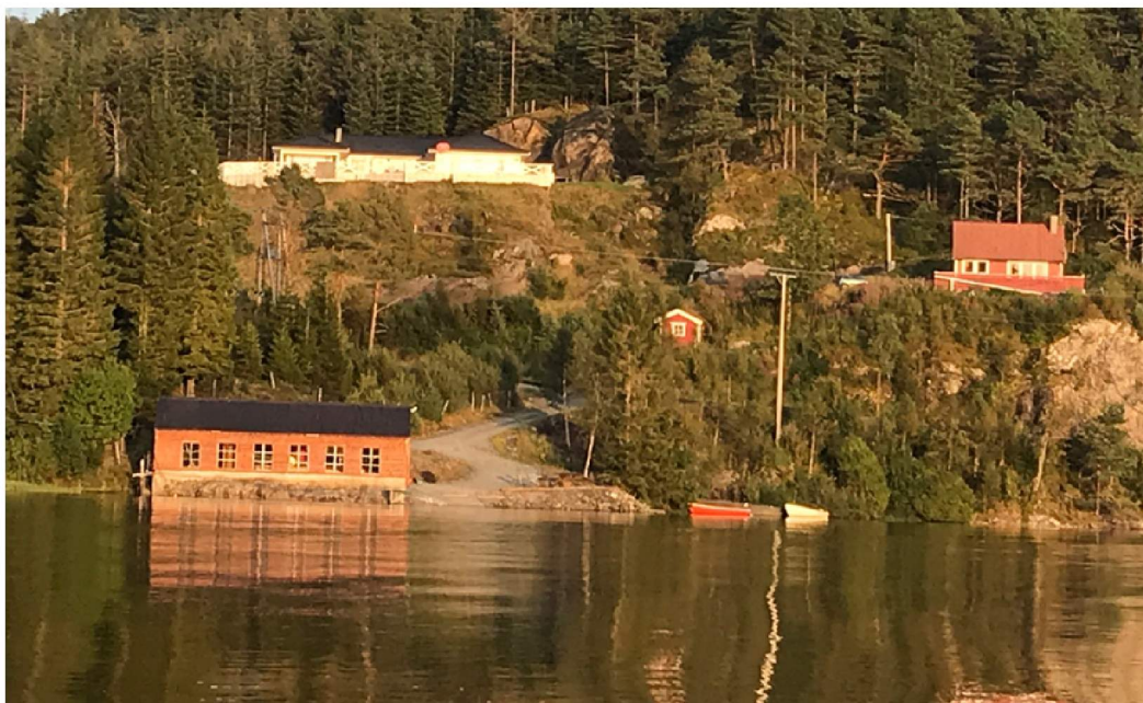
Bjørndal sagbruk 2021 med bustadhus, LNF-spreidd bustad. Planlagt 2 nye bustadtomter i området.

SN_3 Bjørndal Område for sagbruk, lagerplass/lagerbygg, kai /flytebrygge