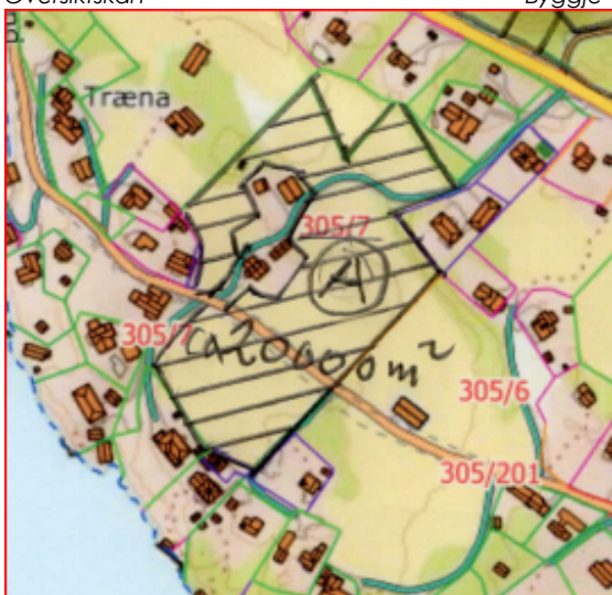
Teig A. Frå situasjonsplanen