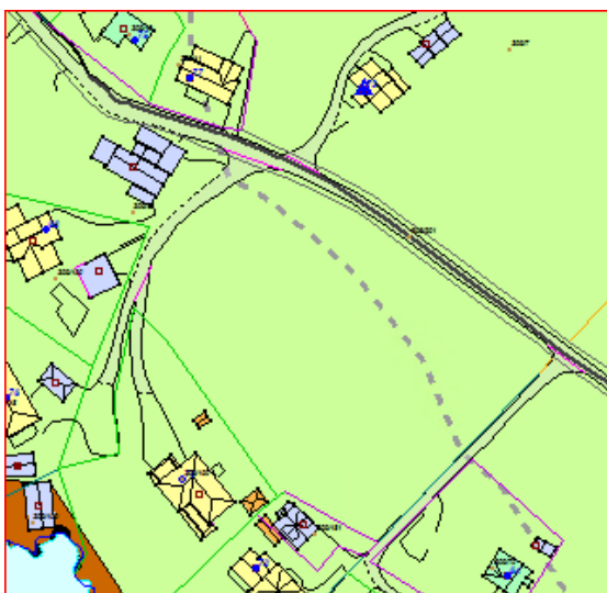
Byggje- og delegrense mot sjø.