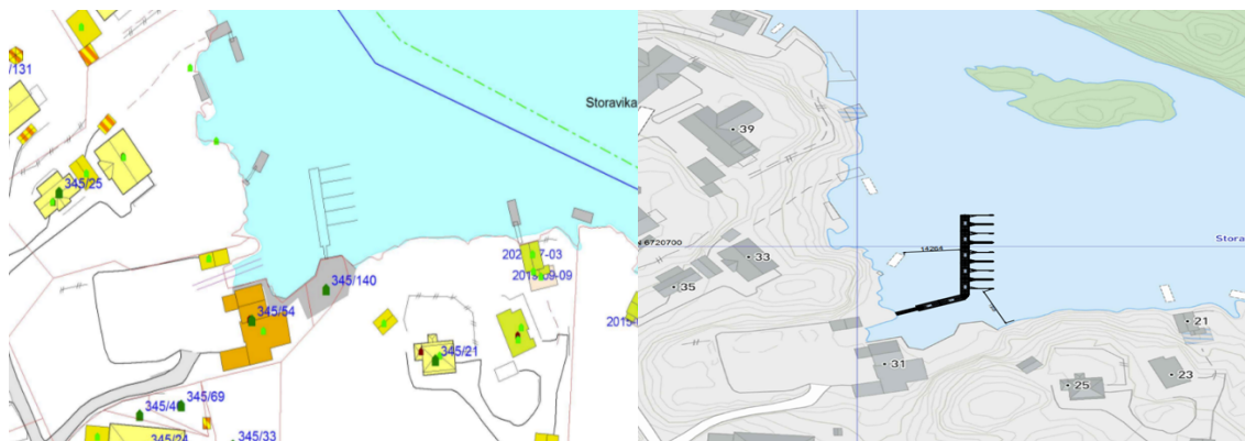
Skjerm bilde fra kommunens kart

Dagens kaianlegg er ikke egnet for å legge til med småbåter og vi er derfor avhengig av flytebrygge for å kunne ha aktiviteter her. I samarbeid med Kvernbit kajakk klubb vil vi tilrettelegge for at alle som padler, inkludert rullestolbrukere har best mulig tilkomst til vannet, det planlegges en spesialbygget rampe til dette formålet. Seil og roklubben trenger tilgang til flytebrygge for rigging og bording av båtene sine, spesielt når de har med seg skoleklasser er dette viktig. Utleie av faste plasser ytterst på bryggen vil muliggjøre finansieringen av anlegget.