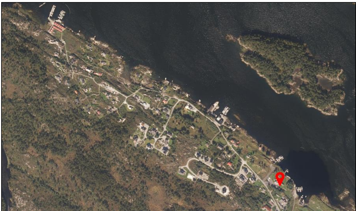
Figur 4: Ortofoto over Vadbu. Gbnr. 102/7 er markert med raud pil. Ortofoto viser at landskapet ved Vadbu er prega av busetnad ved strandsona.

Eigedomane ligg som tidlegare nemnt innafor 100-metersbeltet langs sjøen, og utanfor byggegrensa som sjø som er sett i gjeldande kommuneplan. Hensikten med byggeforbodet i strandsona, jf. pbl § 1-8, er at ein skal sikre allmenn tilgang til strandsona, samt ivareta andre allmenne interesser som natur- og kulturmiljø, friluftsliv og landskap. Eigedomane er som tidlegare omtalt nytta som bustadtomt og tomt for fritidsbustad. Omreguleringa av arealføremål som vert foreslått gjeld ikkje for urørte areal. Det er ikkje registrert viktig naturmangfald, kulturminne/miljø eller friluftsområde i det aktuelle området. Landskapet ved Vadbu er allereie prega at utbygging og tiltak langs strandsona (figur 4). På bakgrunn av dette kan ein ikkje sjå at ein endring av arealføremål og ein justering av byggegrensa i vil utfordre hensikta med byggeforbodet.