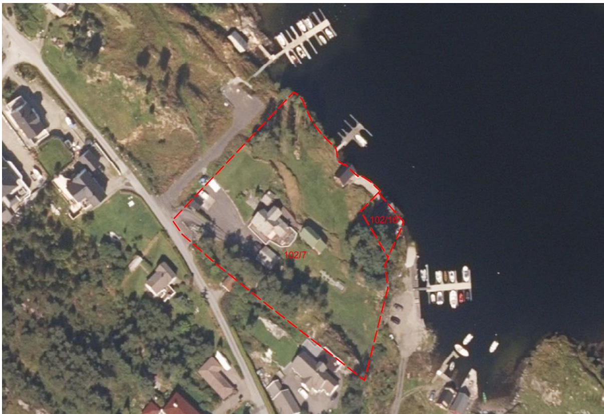
Figur 1: Egedomane som vert omfatta av innspelet er markert med raud stipla linje. Innspelet gjeld også for tilgrensande sjøareal. Ortofoto er frå 2020. Skugge frå trær gjer det noko vanskeleg å sjå fritidsbustaden innafor 102/16.