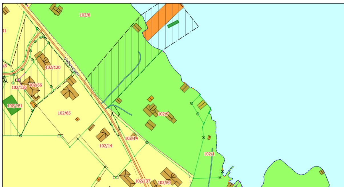
Figur 2: Gjeldande KDP. Egedomen er regulert som LNFR-areal, medan tilgrensande sjø er regulert som bruk og vern av sjø og vassdrag med tilhøyrande strandsone.

Egedomane er i gjeldande kommunedelplan (KDP) for Lindås regulert som LNFR-areal (5100), medan tilgrensande sjøareal er regulert som bruk og vern av sjø og vassdrag med tilhøyrande strandsone (6001), sjå figur 2. Egedomane ligg utanfor byggegrensa mot sjø som er sett i gjeldande KDP (figur 3).