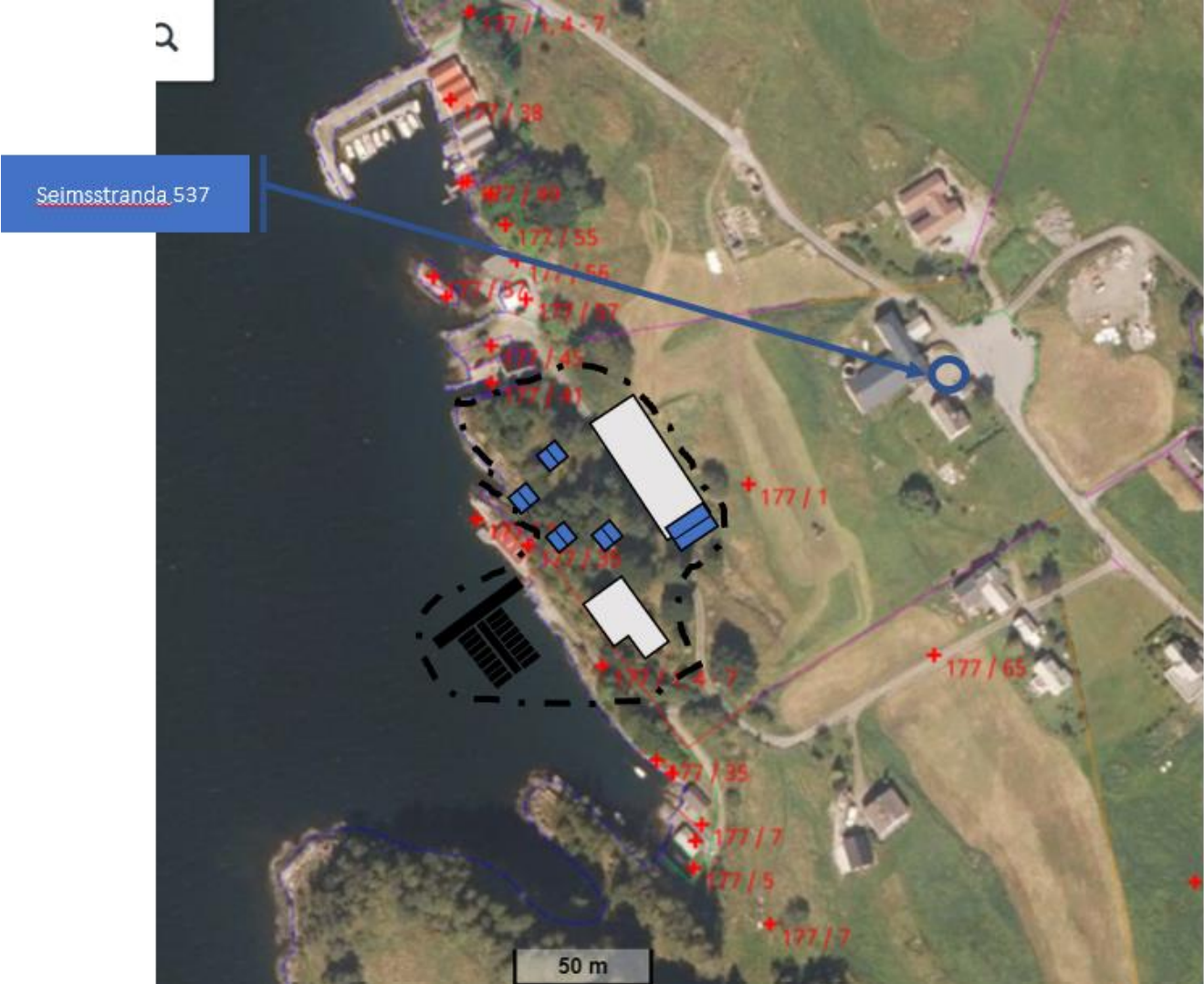
Kart 3, området. Area til innspill markert med - - - - -