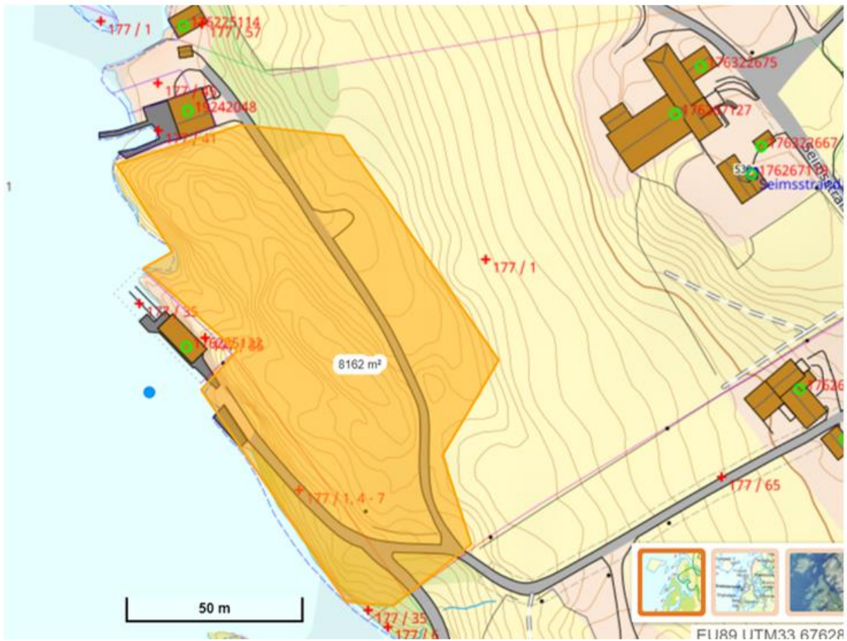
Kart 4, ca areal på innspill, ca 8 mål