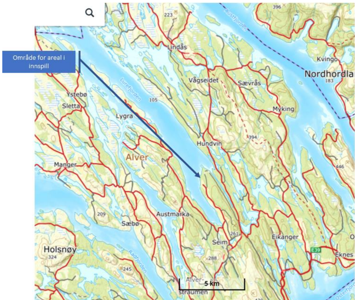
Kart 1. Plassering av område