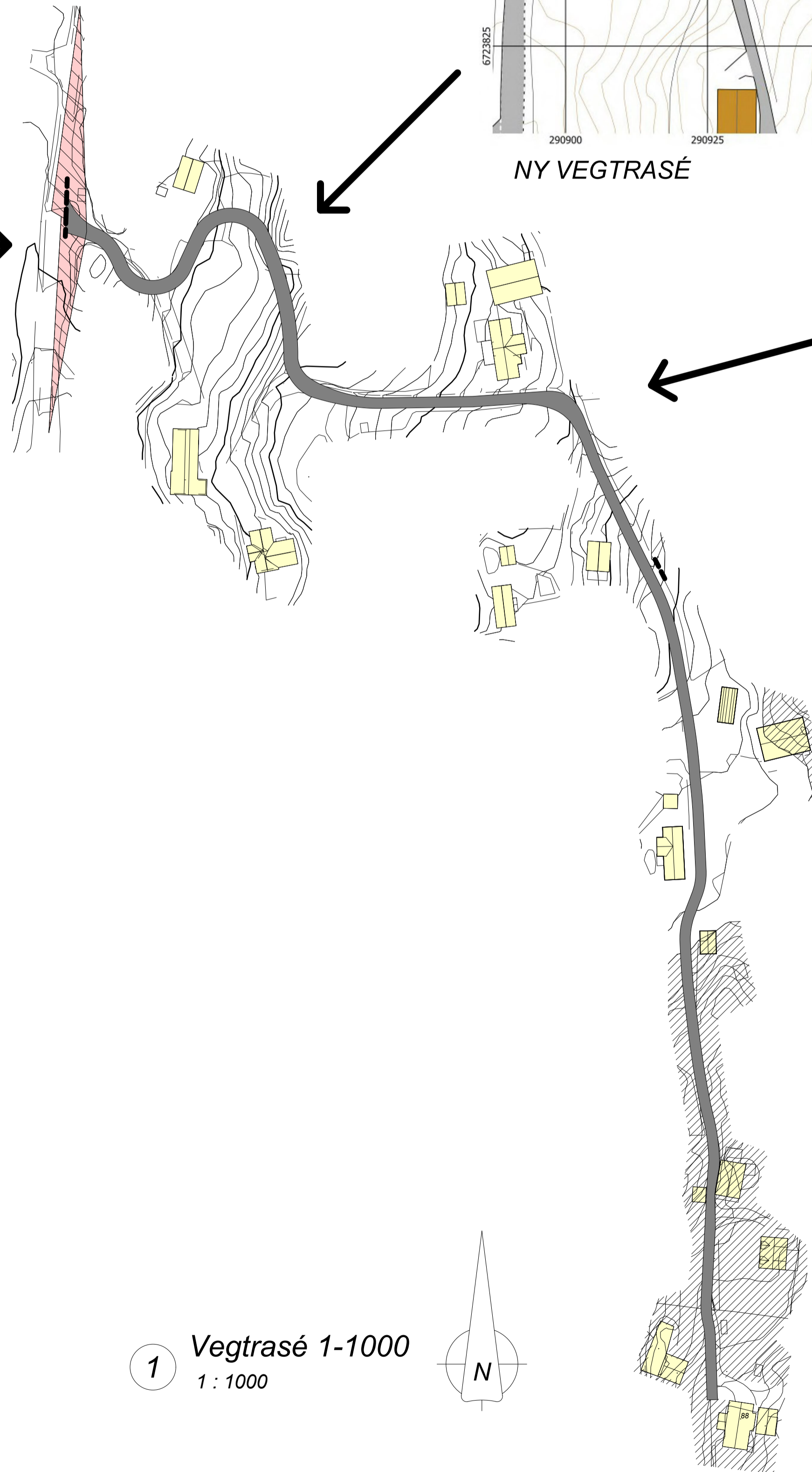
1 Vegtrasé 1-1000 1 : 1000