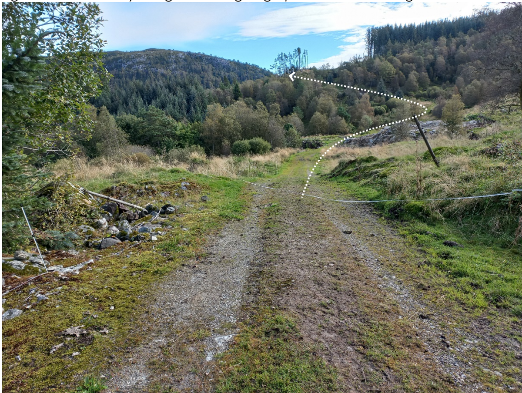
Fig. 5. Vidare over mot øvste høgdedraget skal vegen gå om lag slik som den stripla lina syner. Øvst oppe er vegen i praksis ikkje eksisterande slik det går fram av fig. 6 nedanfor.