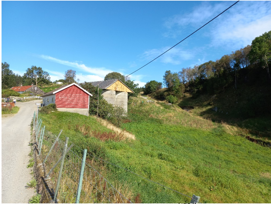
Fig. 2. Vegen skal starte frå den kommunale vegen som syner på biletet. Den skal gå framom siloane og opp mot eksisterande veg som syner til høgre i for