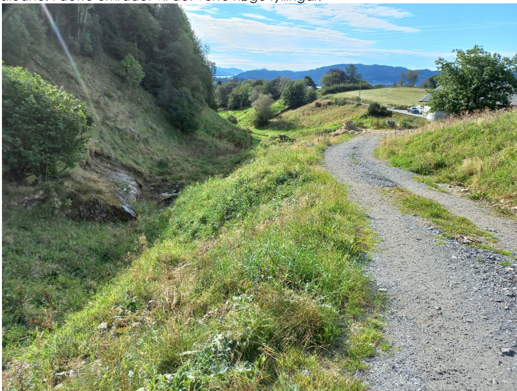
Fig. 3. For å vinne nok høgde frå området ved driftsbygningen, kan det vere aktuelt å leggje vegtraséen i «dalsøkket» parallelt med eksisterande veg.

siloane. I dette området vil det verte høge fyllingar.