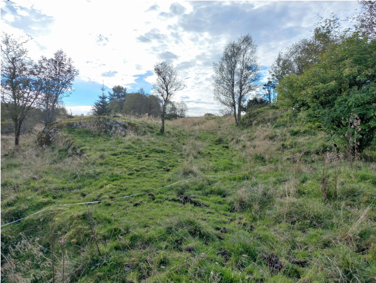
Fig. 7. Om lag der biletet 5 (fig. 5) er teke i frå (sjå òg fig. 1), ynskjer søkjar å lage ein sideveg og etablere ein snuplass for bilar.

I samband med vegbygginga skal det takast ut massar på om lag 450m 3 . Det er ikkje klårlagt kvar dette masseuttaket skal skje. Kvar uttaket skal skje og korleis det er enkelt gjennomført må merkast av på kart og sendast kommunen før arbeidet med vegen startar opp.