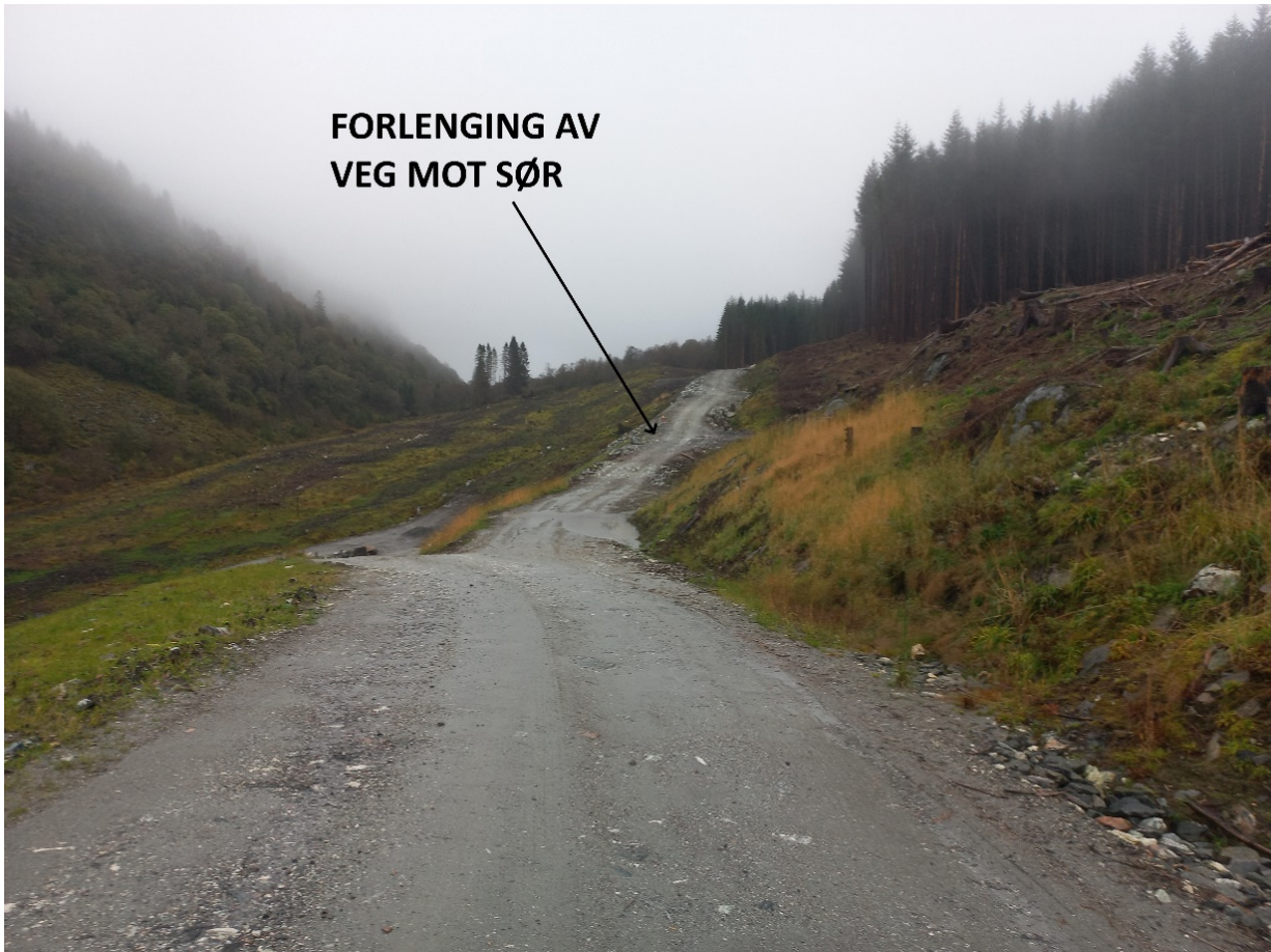
Fig. 5. Også mot sør er vegen forlenga i høve opphavelig søknad. Dette er gjort for å få tak i skogen i øvst i høgre biletkant som veks oppover mot Isdalsfjellet til høgre i biletet.

I høve den opphavelig søknaden, er veganlegget òg forlenga mot sør – sjå fig. 1 side 1 og fig. 5. nedanfor. Dette er gjort for å få tak i skogen som syner i høgre biletkant i fig. 5.