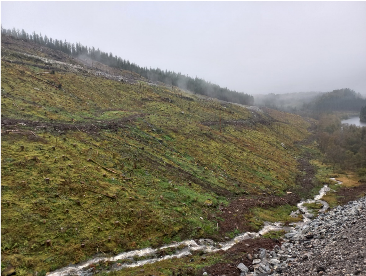
Fig. 6. Vegen ligg fint til og med god terrengtilpassing i lia på andre sida av bekken.