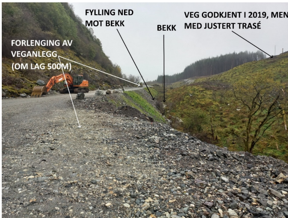
Fig. 3. Eksempel på område ein må dekkje til vegfylling med stadeigen og ikkje tilkøyrte masse.

Normalt vil vi ikkje tilrå at vegfyllingane vert tilsådd då slik tilsåing inneber at plantar som etablerer seg, står fram som eit framandelement i høve kringliggjande vegetasjon. I dette tilfellet meiner vi slik tilsåing likevel bør gjennomførast. Dette for å få ei så rask planteetablering som mogeleg og slik redusere faren avrenning til Langavatnet.