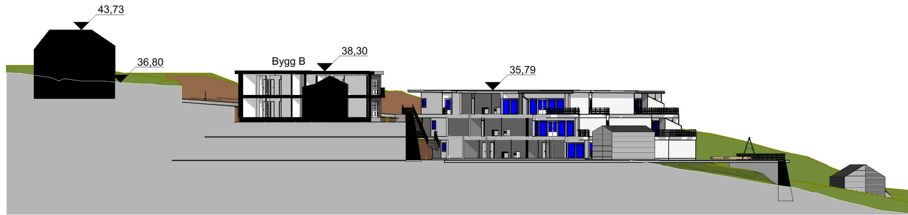
1:500 Terrengprofil Vest