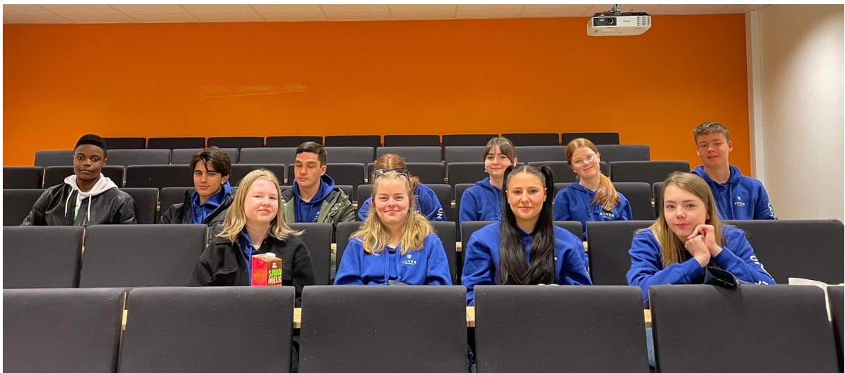
Frå Knarvik Ungdomsskule