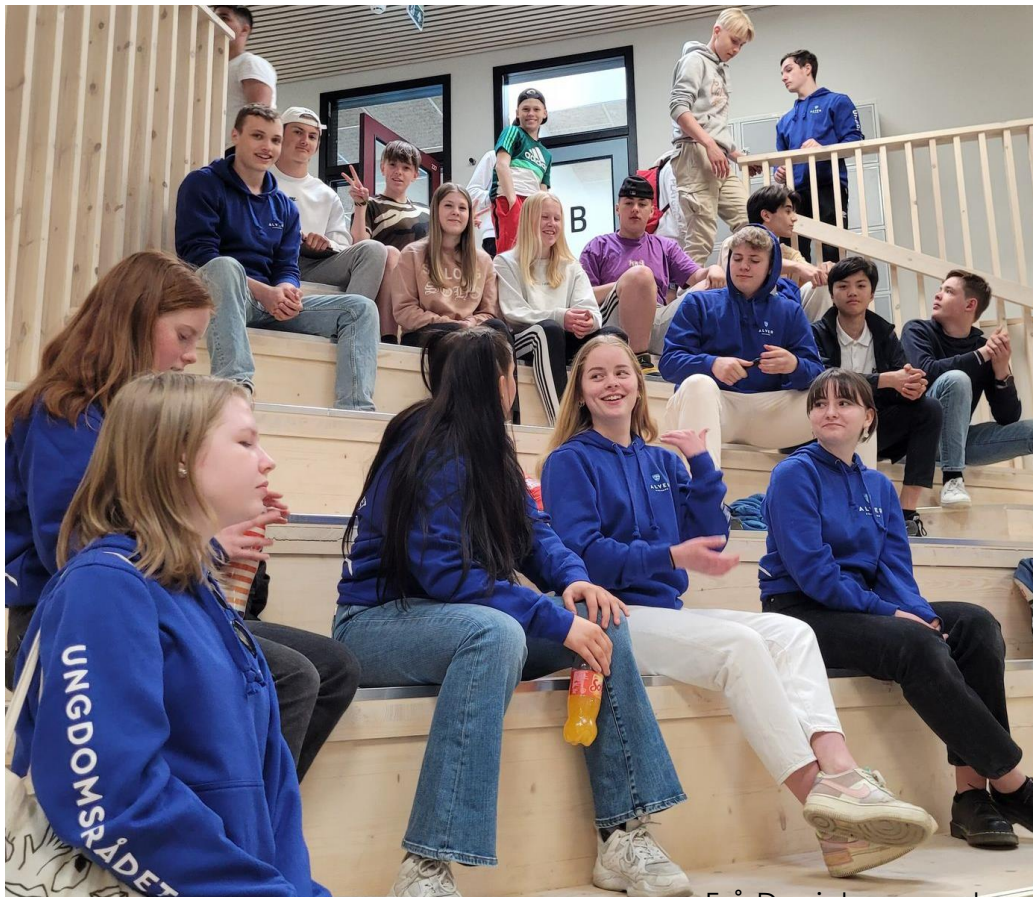
Frå Danielsen ungdomsskule