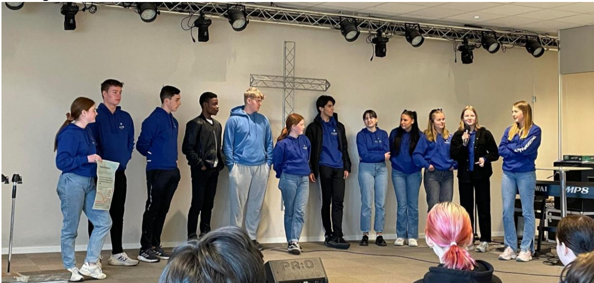
Frå Nordhordland Kristne Grunnskule

Vi fortalte om kva ungdomsrådet er, òg fekk innspel på sakar og tema som var viktig for ungdomane.