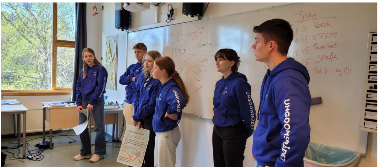
Frå Rosland skule