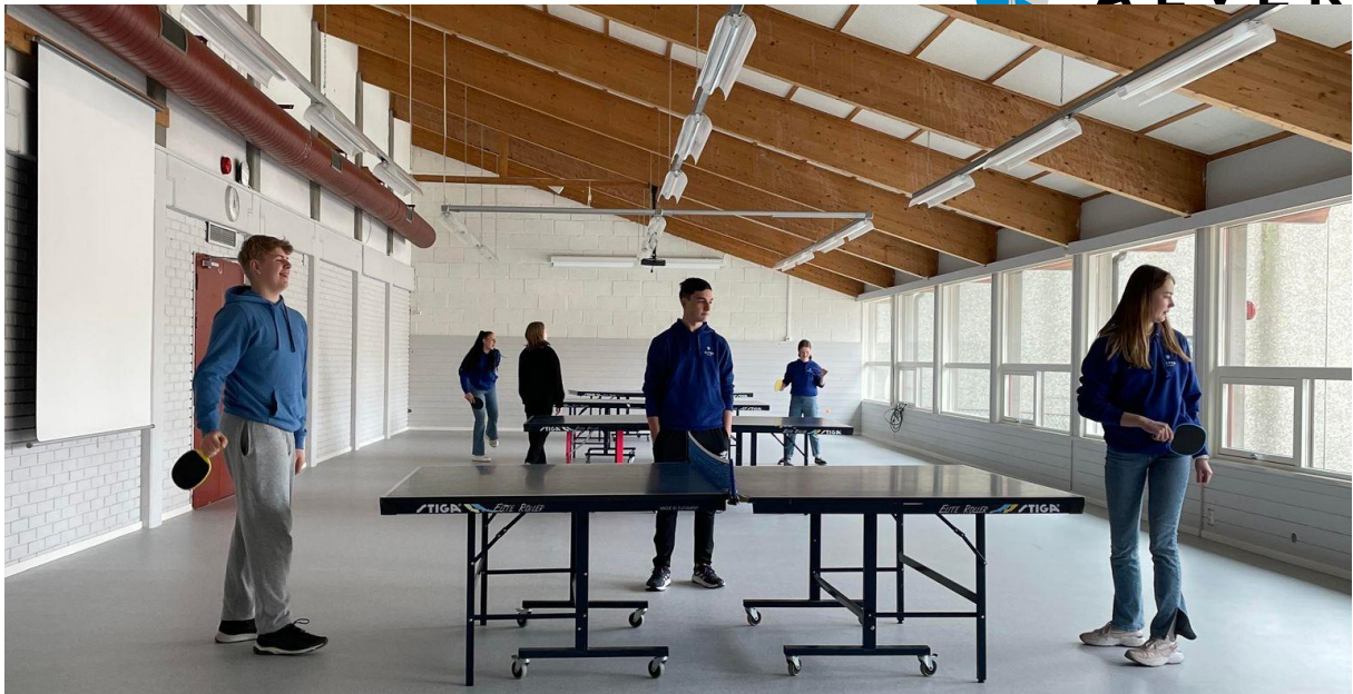
Frå Radøy Ungdomsskule