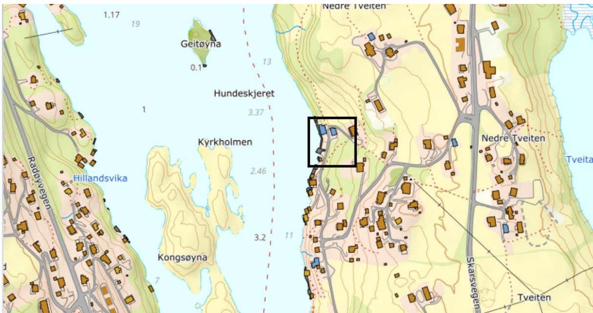
Figur 2: Oversiktskart over området. Lokalisering for aktuelt gards- og bruksnummer er ramma inn i svart.

Saka løftast opp til politisk handsaming grunna at avhending av eigedomen vil vere i strid med retningslinjene for sal av kommunal eigedom.