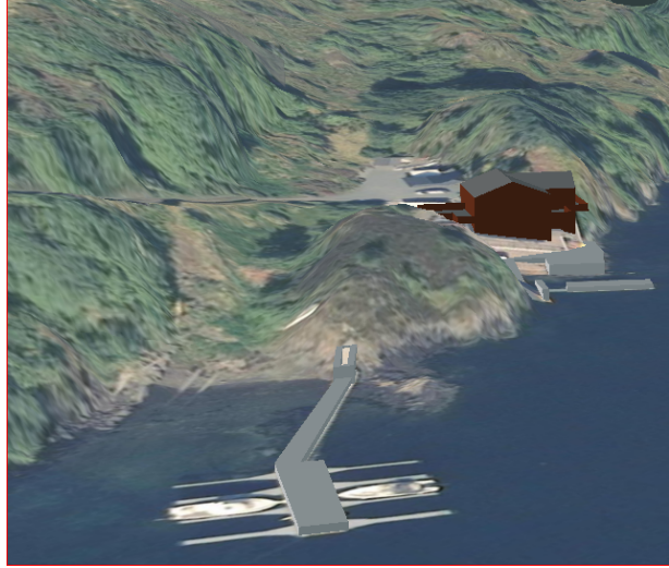
3D kart. Sett mot nordvest.