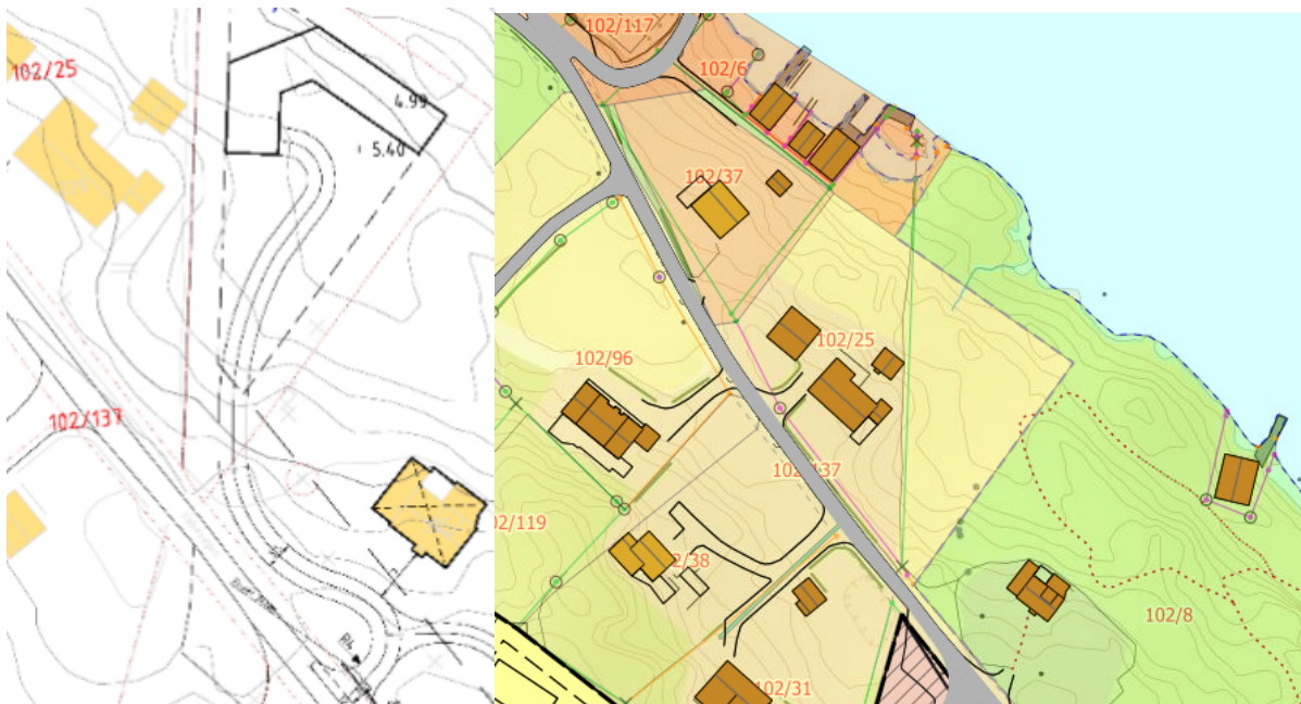
Figur 1 kartskisse som viser tomt og tilkomstveg og utsnitt frå arealplan for området.