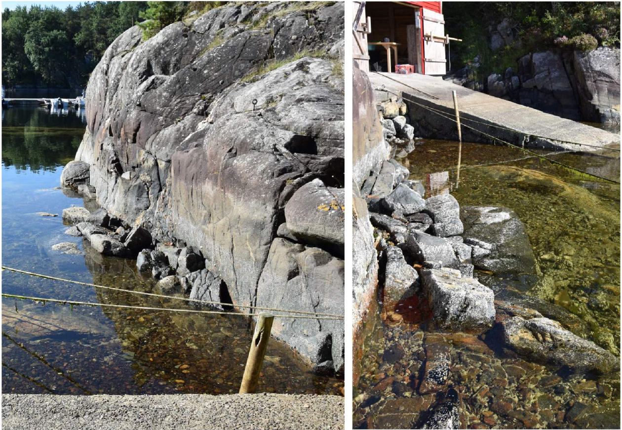
Bileta viser kor bratt terrenget er og dermed ueigna for ferdsel og opphald, samt kor grunt det er. Området i sjø er dermed ikkje eigna for fiske slik det er i dag.

Etter lova sin formålsføresegn skal plan- og bygningslova «fremme bærekraftig utvikling» og ivareta «hensynet til barn og unges oppvekstvilkår og estetisk utforming av omgivelsene». Ettersom parsellen allereie er bebygd og dermed ikkje urørt, samt tilgjengeleg for ålmenta, kan vi heller ikkje sjå at desse omsyna blir vesentleg sett til side ved ein dispensasjon. Tilsvarende gjeld for nasjonale og regionale interesser.