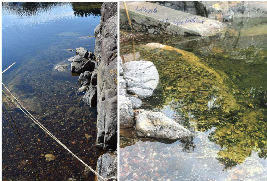
Bileta viser kor grunt her er. Det er dermed vanskelig å legge til med båt til eigedomen på ein trygg måte.

fjøre sjø. Då må søkjar gå på skråplanet/opptrekket som er sleipt av groe. Ved maksimal fjøre flyt ikkje båten inntil opptrekket, så då må han ned i fjøra for å gå om bord. Bileta under viser kor grunt her ved fjøra sjø.