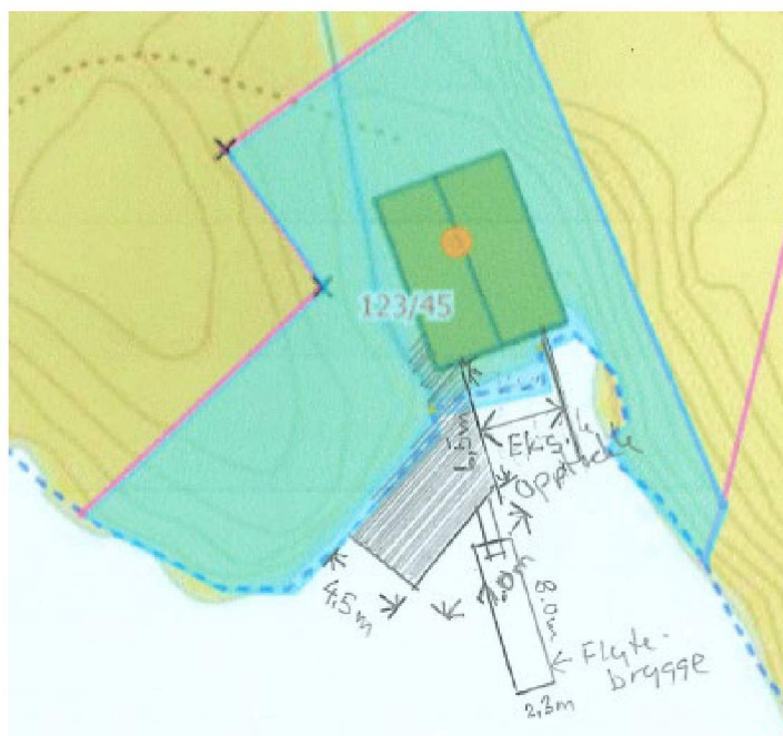
Kart med tiltak.

Kai blir omsøkt med om lag 31 m 2 og flytebrygge med om lag 18 m 2 med tillegg av langgang, som vist på kartet under: