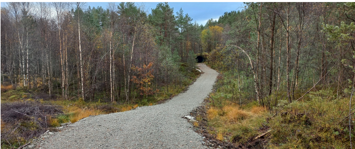
Fig. 2. Vegen er alt bygd. I bakgrunnen ser vi kryssinga av fv 57.