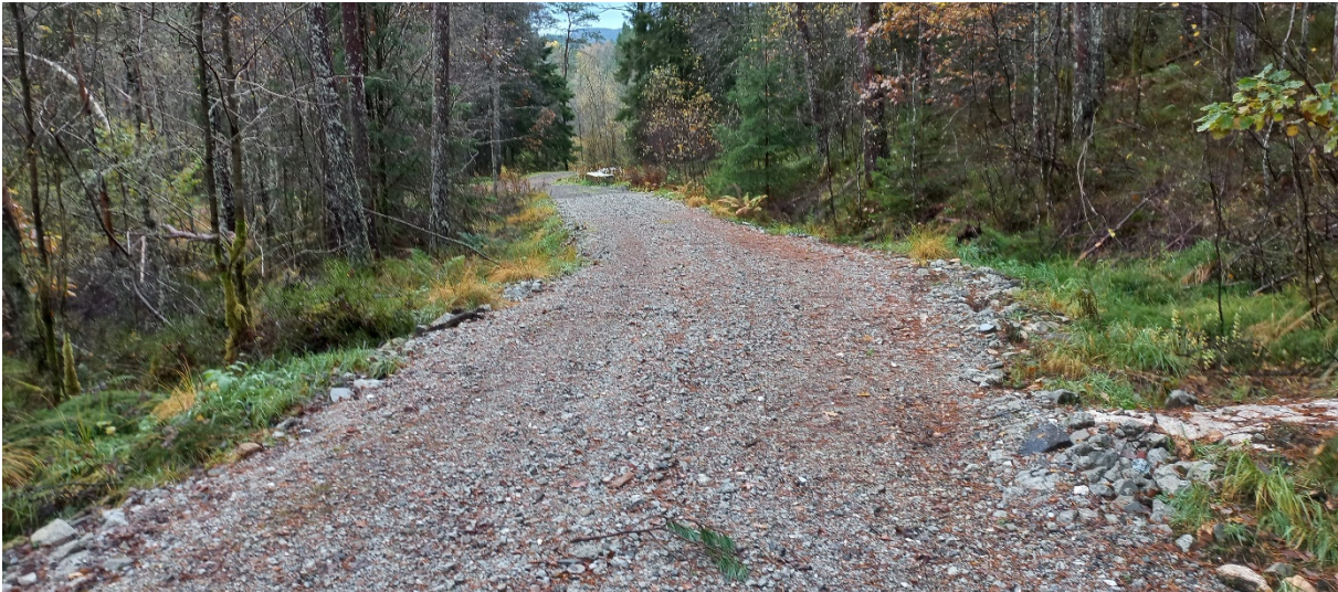
Fig. 3. Vegen, der den er bygd, er nokre stader noko smal. Stadvis kan det vere knapt med stikkrenner.

Føremålet med saka er å få avklart om vegen kan godkjennast slik den ligg føre d.v.s. om mellom anna ålmenne interesser er tekne i vare.