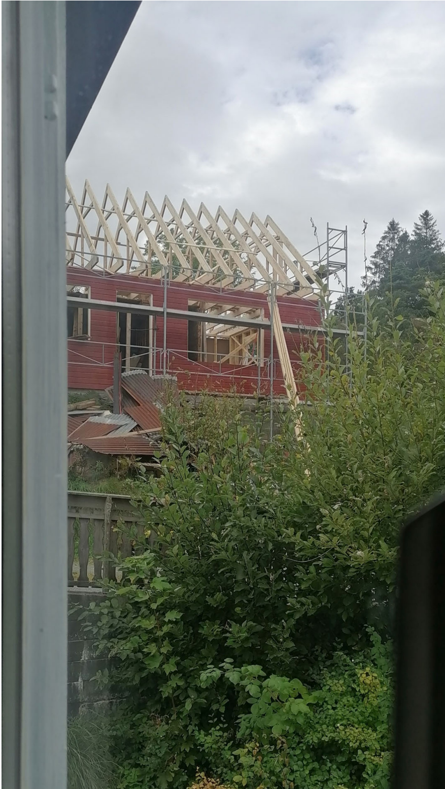
Foto tatt 10.10.2021. Ser man på grenene på treet som skimtes bak takstolene og sammenligner med foto av opprinnelig bygg, så ser man at høyde på møne er økt vesentlig mer enn 20-30 cm. Ift. opprinnelig høyde.