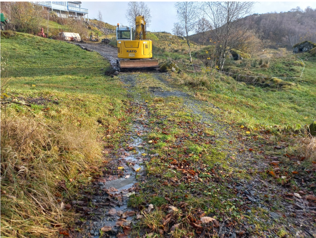
Fig. 6. I høve landbruksinteressene kan ein òg tenkje seg at tilkomsten til innmarka skjer om lag der gravemaskina står. Bnr. 3 er bak fotografen.