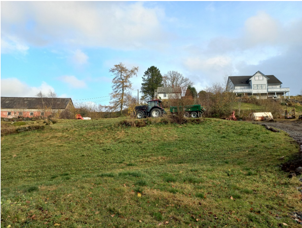
Fig. 3. Vegen går nedanfor tunet før den brått svingar ned i retning mot bnr. 3