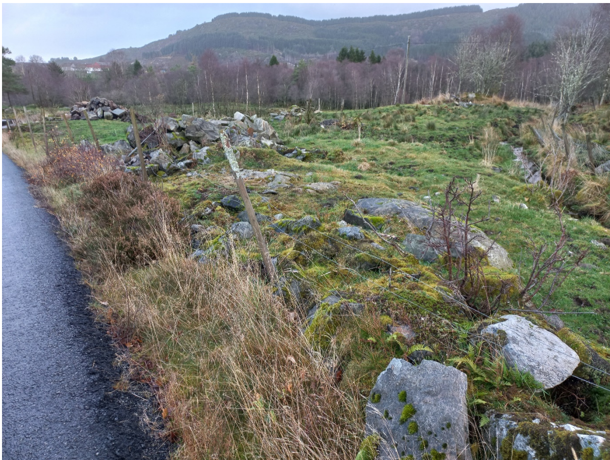
Fig. 7. Thilesen ynskjer p-plassen lagt frå næraste steinrøys, opp mot fotografen og over bekken til høgre. Dette for å spare beitet. Bekken må i så fall lukkast, noko som er søknadspliktig – sjå fig. 8 og tilhøyrande tekst. Skal ein unngå bekkelukking må p-plassen flyttast lenger ned og då går det med meir beite.

P-plassen er tenkt plassert om lag slik det syner i fig. 7 nedanfor.