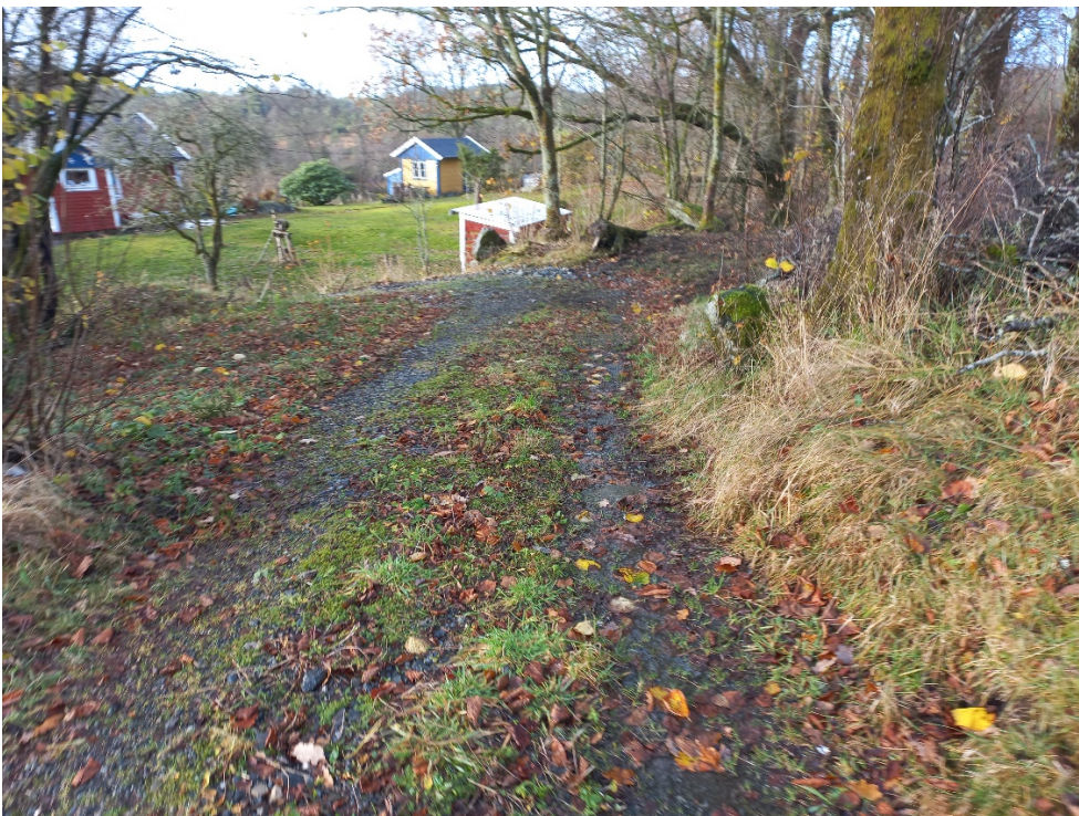
Fig. 4. Vi ser bnr. 3 og at vegen tett ved grensa svingar til venstre der den går ned til fulldyrka jord langs grensa til bnr. 3. Denne svingen er lite tenleg i høve framkome for landbruksmaskiner.