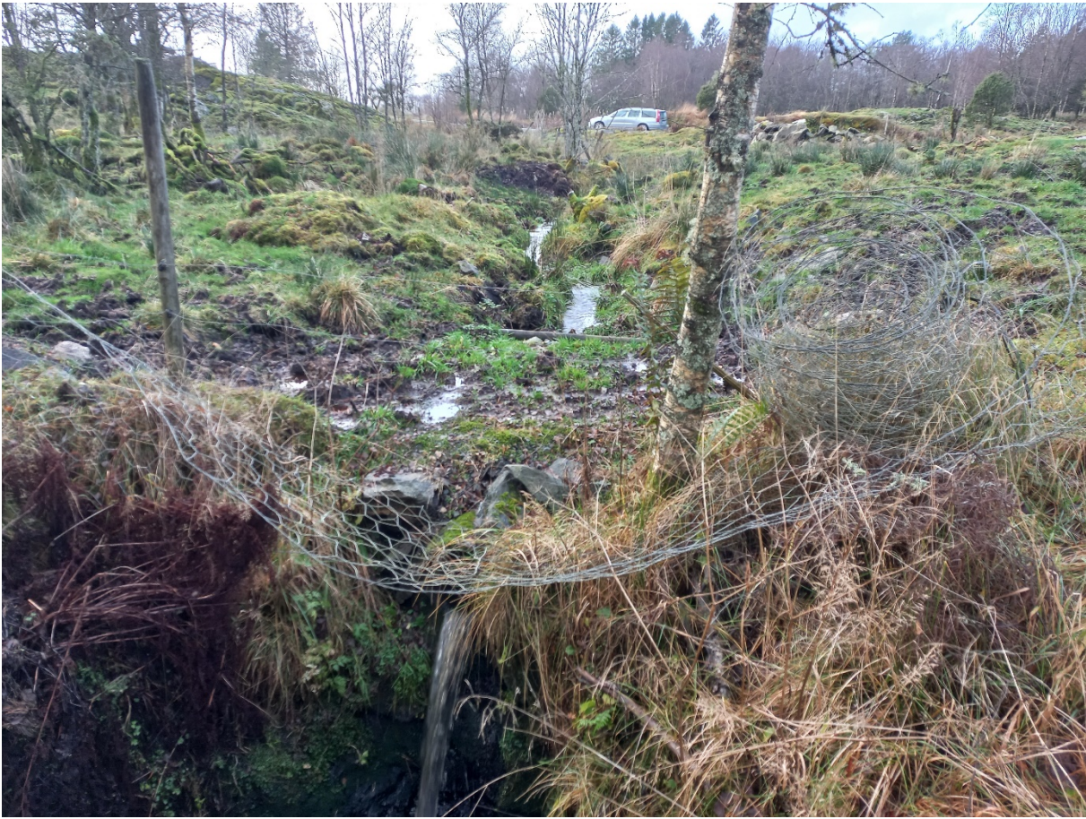
Fig. 8. Thilesen ynskjer å lukke bekken frå bilen og ned til der bekken er lukka om lag 3 m.

Utan nærare opplysingar, gjer vi ikkje konkret vurdering av dette spørsmålet ut over at slik bekkelukking er søknadspliktig, noko som vart signalisert under synfaringa.