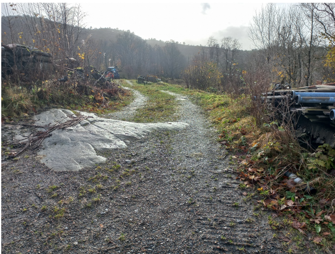
Fig. 2. Vegen startar om lag her frå snuplassen. Tunet til bnr. 2 ligg til venstre slik det går fram av fig. 3.

Utan ein konkret søknad kan det vere vanskeleg å svare meir konkret enn dette, men vi tek med bilete som syner veglina.