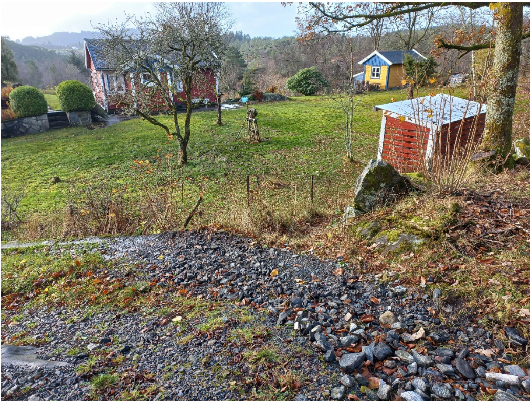
Fig. 5. Ved bnr. 3 er det om lag 1 m høgdeskilnad frå vegen og ned på høgda på bnr. 3.