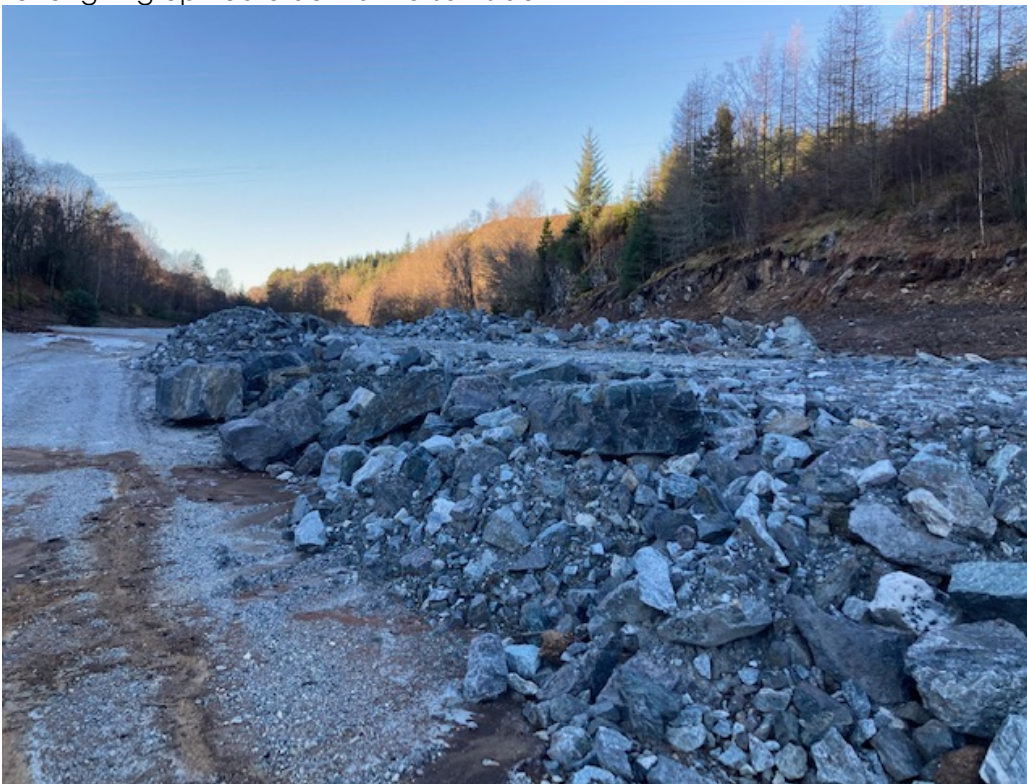
Terrenginngrep nedre del