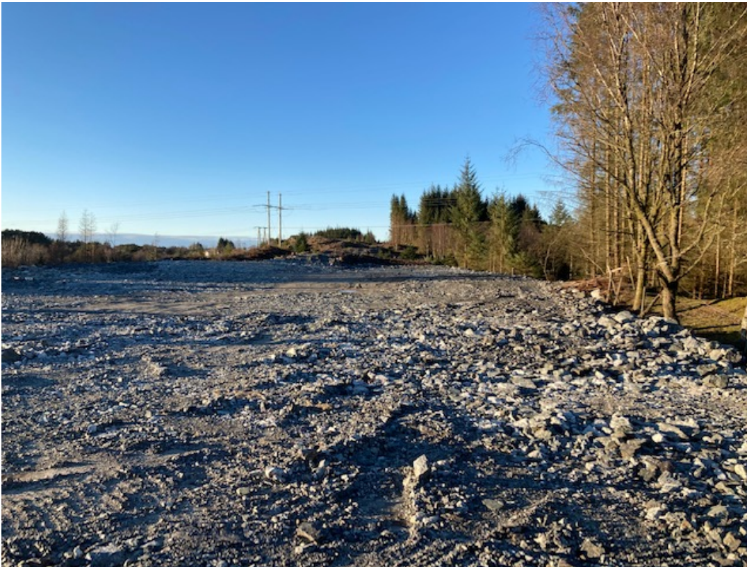
Ferdig planert område øvre del