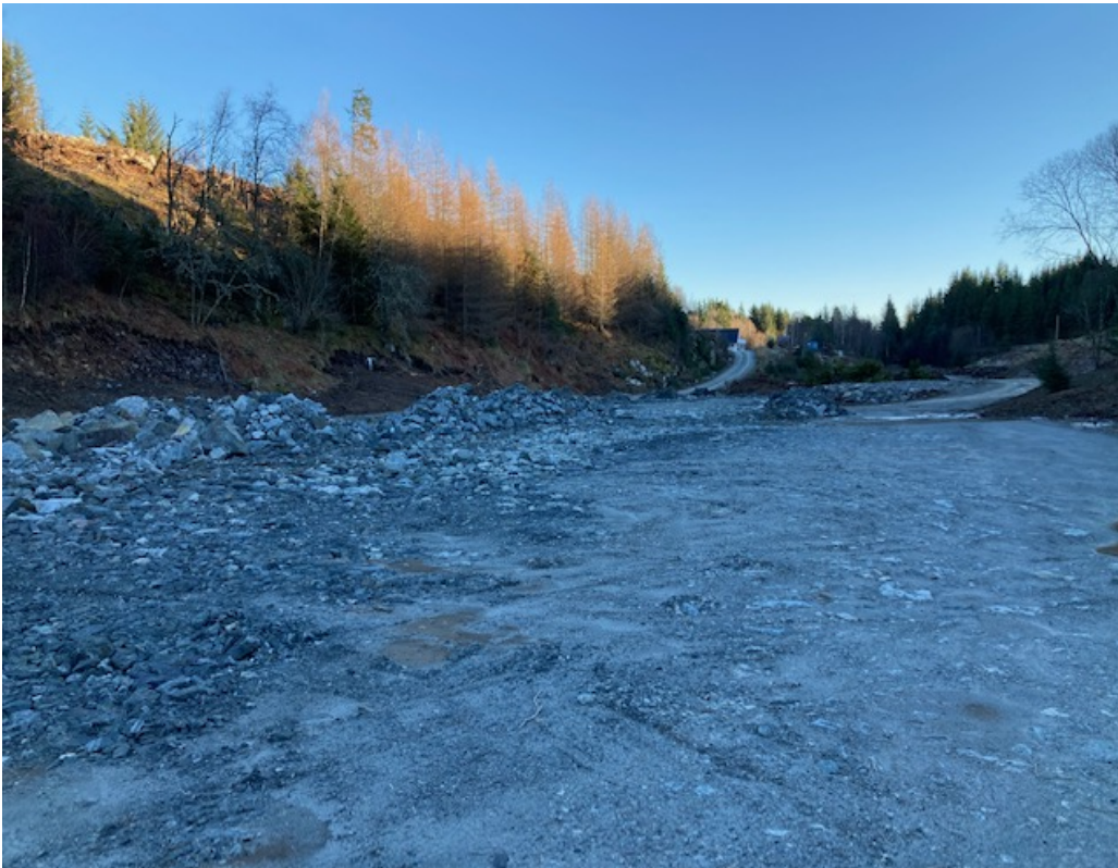
Terrenginngrep nedre del frå motsatt side